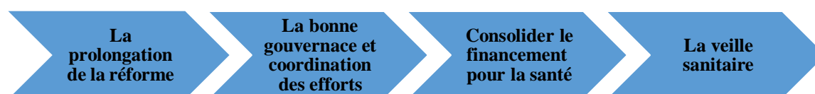
Figure 2 : Les éléments de réussite selon le NMD :

La CSMD propose un ensemble des propositions pour la réforme du système de santé, qui sont très importants pour renforcer des systèmes de santé et le rendre utile et fiable. Toutefois il faut mettre en œuvre un certain nombre d'éléments afin d'assurer la réussite du NMD en matière de santé :