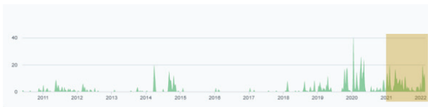
Figure 1 – Frise chronologique des contributions « commits » au sein du logiciel NoiseModelling depuis sa création. En jaune la période du projet de couplage PlaMADE avec NoiseModelling.

Les recueils de données d'entrée constituent des phases particulièrement consommatrices de temps et de moyens. Les données d'entrée utilisées proviennent de sources multiples, parfois très hétérogènes (données de trafic en particulier). Elles sont quelquefois reproduites voire dédoublées par les différentes autorités compétentes, faute notamment d'une organisation technique unifiée, structurée et pérenne. Elles nécessitent également a minima un reformatage mais plus généralement une ré-exploitation en profondeur, voire parfois des approximations et forfaitisations qui nécessitent des compétences allant bien au-delà de l'acoustique. Par manque d'organisation, les validations intermédiaires des données d'entrée par les fournisseurs externes ou des données de sortie par les futurs utilisateurs peuvent allonger les délais de production des