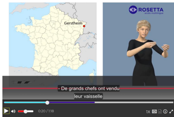
FIGURE 3 – Prototype de traduction français vers LSF du projet Rosetta

de ce travail sont donc liées à la possibilité de développer un corpus aligné de très grande taille ainsi que des outils permettant en particulier de faciliter l'alignement entre la LSF et le français.