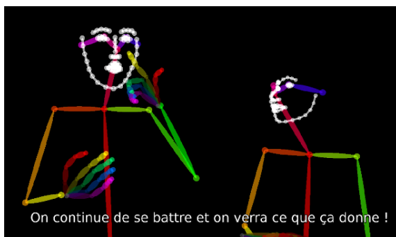
FIGURE 1 – Extrait du corpus MEDI-API-SKEL

MEDI-API-SKEL 7 a été élaboré à partir de contenus fournis par Média'Pi!, un média en ligne bilingue en LSF et en français. De nombreux thèmes y sont abordés, sous forme d'actualités présentées par des journalistes ou présentateurs sourds, d'interviews ou reportages avec plusieurs intervenants, ou d'autres formes plus atypiques (photos-reportages, BDs). La langue première de ces contenus est la LSF. Dans un second temps, un sous-titrage en français est produit. La version actuelle déposée sur Ortolang contient 27 heures de données préparées pour des études en TALS (Bull et al. , 2020) : des sous-titres alignés avec des vidéos comportant une représentation simplifiée des signeurs sous forme de squelettes 2D avec des points clés sur le visage, les mains et le corps (figure 1). Les vidéos originales sont accessibles par le biais d'un abonnement auprès de Média'Pi.