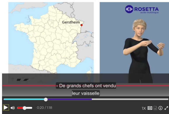
FIGURE 3 – Prototype de traduction français vers LSF du projet Rosetta

de ce travail sont donc liées à la possibilité de développer un corpus aligné de très grande taille ainsi que des outils permettant en particulier de faciliter l'alignement entre la LSF et le français.