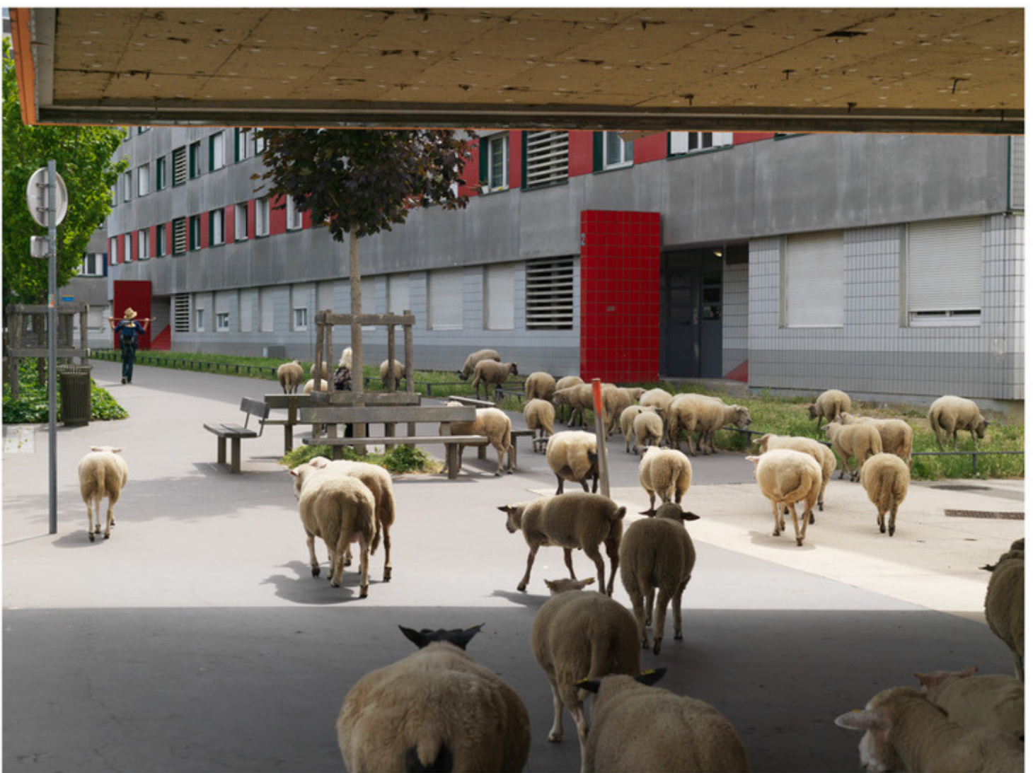
La Courneuve, juillet 2017

En Seine-Saint-Denis, les bergers urbains de l'association Clinamen mettent à disposition leur troupeau d'environ 60 têtes pour effectuer un service d'éco-pâturage. Les municipalités voient là un moyen d'entretenir leurs espaces verts ainsi qu'une manière d'encourager, par le biais de la présence animale en ville, une nouvelle forme de sociabilité. Pour Plaine Commune Habitat, les bergers urbains assurent une fois par mois une transhumance pour permettre à leur troupeau de pâturer au pied des immeubles, comme ici à la cité des 4000 à La Courneuve.