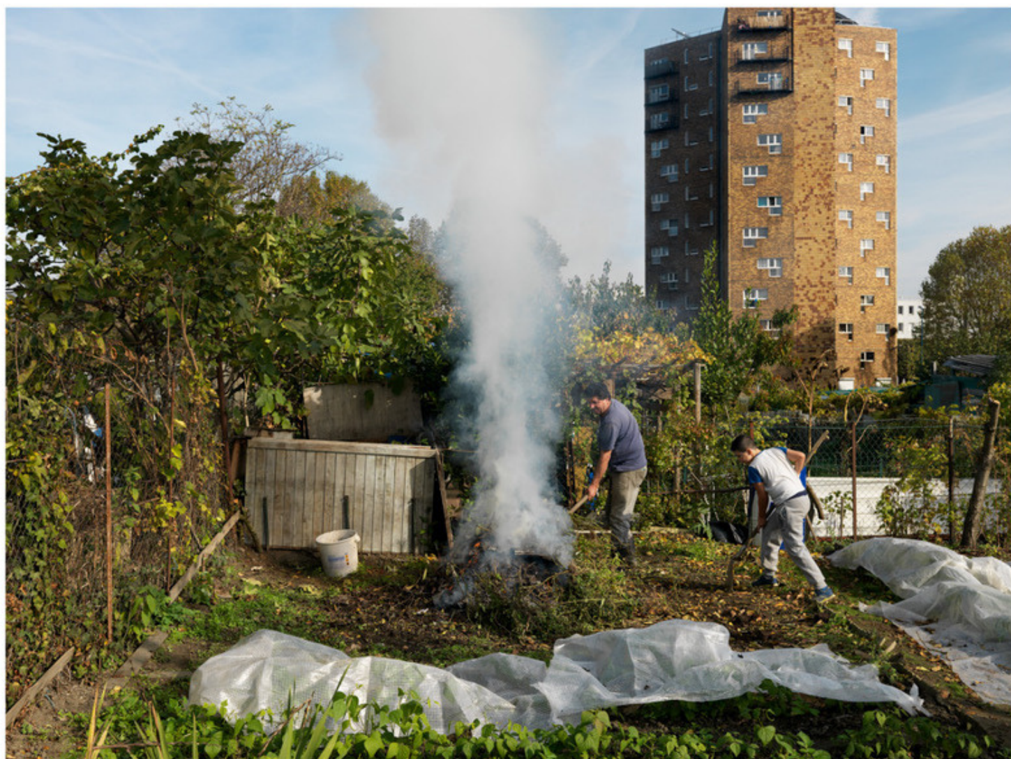
Aubervilliers, novembre 2016