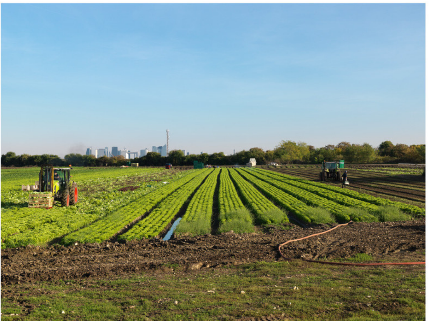
Montesson, octobre 2016

La plaine de Montesson située dans une boucle de la Seine à l'ouest de Paris est l'un des derniers lieux de production maraîchère de la métropole. On y cultive des légumes depuis le XIXe siècle, et c'est seulement après-guerre que la production s'est orientée principalement vers la salade, le sol sablonneux de la plaine étant parfaitement adapté à ce type de culture. L'entreprise Légume Français fait partie de la quinzaine d'exploitations qui produisent 25 millions de plans, soit 40% de la production régionale. Ces salades, cultivées à partir de jeunes plans en provenance de Hollande, sont distribuées pour l'essentiel dans des grandes et moyennes surfaces de la région, mais sont aussi vendues sur les marchés ou encore directement au consommateur.