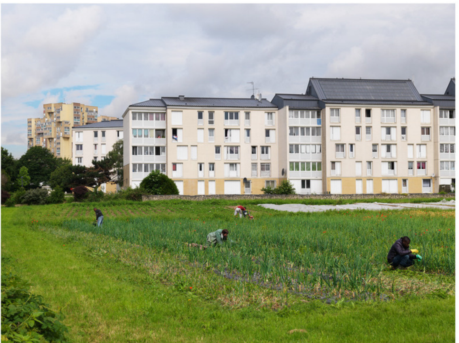
Sevran, juin 2016

Situés sur la butte de Montceuleux en Seine-Saint-Denis, les jardins biologiques d'insertion du Pont-Blanc accompagnent vers l'emploi des personnes en difficulté à travers un projet de maraîchage en agriculture biologique. Chaque année depuis 1997, une cinquantaine de salariés en insertion produisent ainsi 20 tonnes de légumes sur 1,4 hectares, que l'association vend ensuite sous forme de paniers. Ici, 4 salariés entretiennent une parcelle d'oignons. Les compétences acquises lors de leur contrat leur permettront de chercher un emploi dans les domaines de l'agriculture biologique ou de l'entretien de jardins et d'espaces verts.