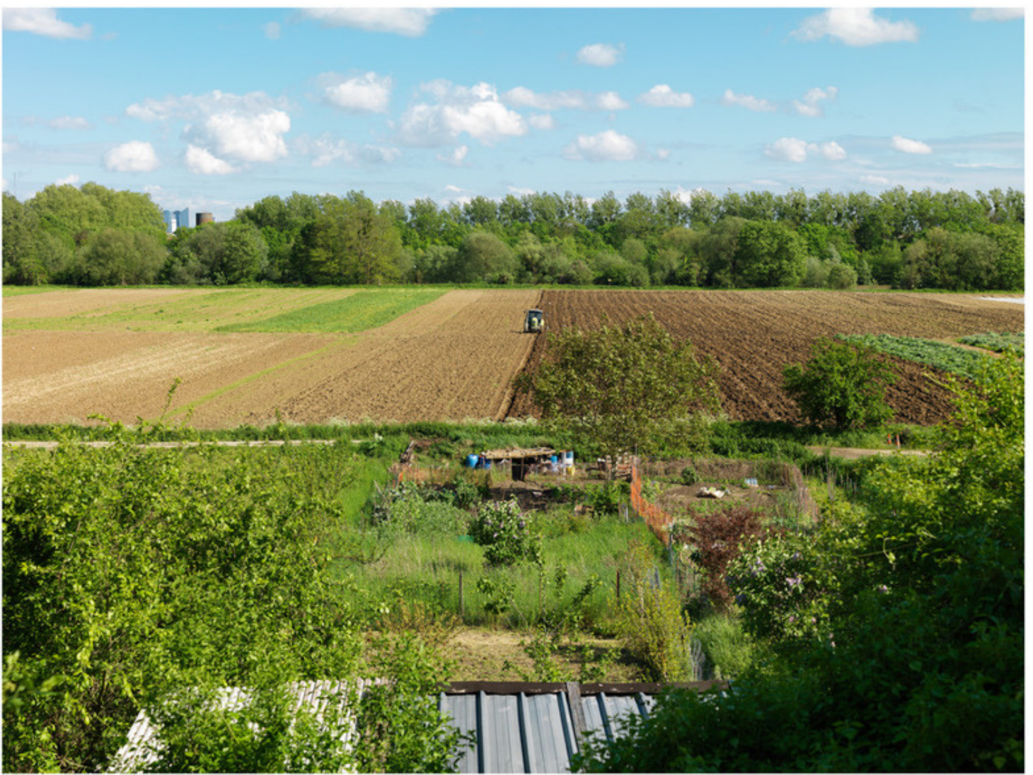
Le Mesnil-le-Roi, avril 2015

Vue sur les champs de bords de Seine de l'EARL Guehenneec. Au fond entre les arbres, les tours de la Défense.