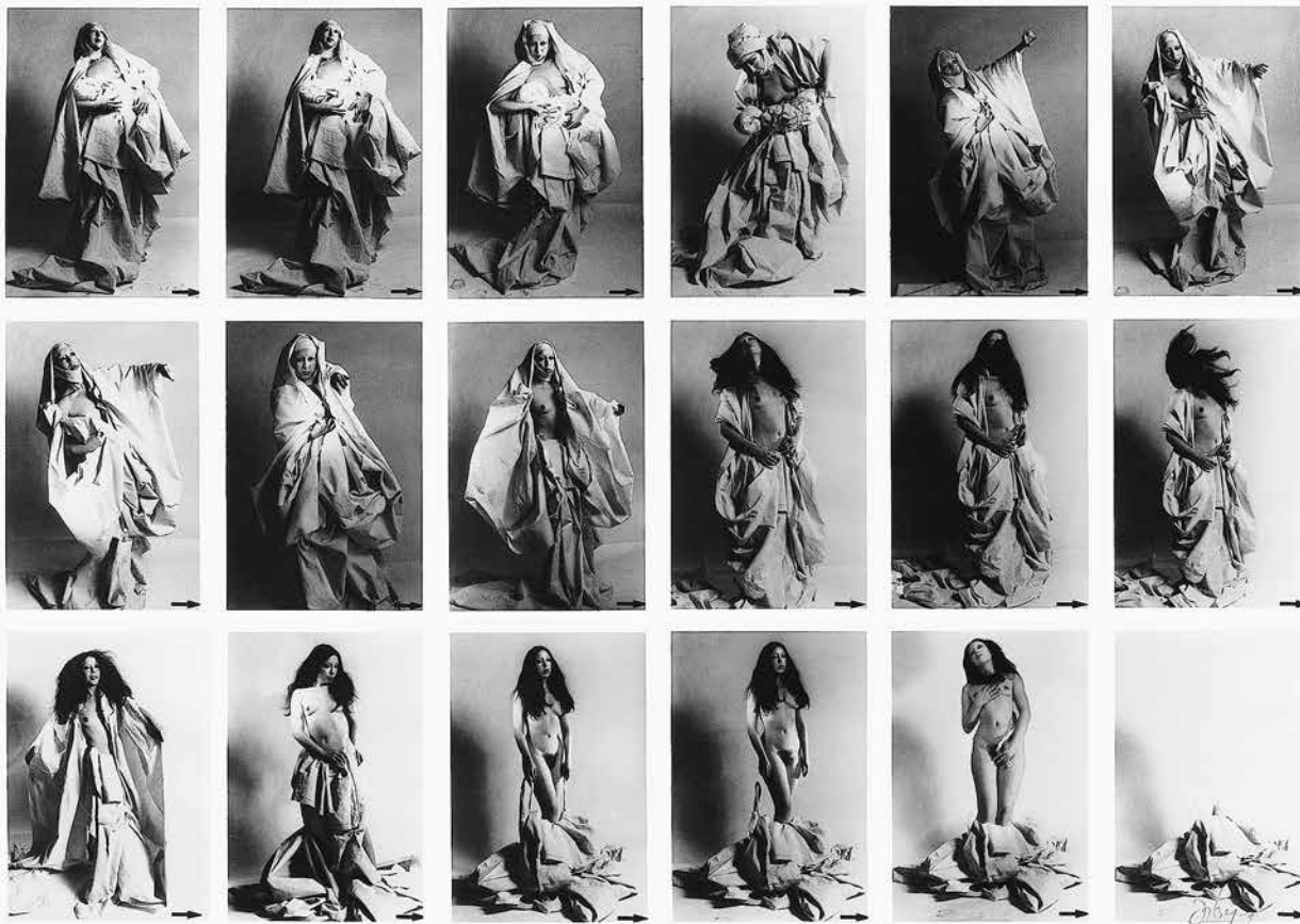
Fig. 3 – ORLAN, Strip-tease occasionnel à l'aide des draps du trousseau , 1974-1975, dix-huit photographies noir et blanc réalisées en 1974 et réunies en une même œuvre en 1975, 44 × 60 cm chacune, Paris, Collection Fonds national d'art contemporain.

qui s'efface pour asseoir la présence de l'artiste. Ce travail se rapproche ainsi de la conception de la lumière du Caravage, dont l'éclairage appuyé des scènes met en lumière la gestuelle des personnages et accuse le contraste avec l'obscurité 27 . La lumière s'engouffre alors dans les plis du drapé rendant compte de sa matérialité et de sa plasticité : elle s'enfonce dans les creux et se reflète sur les surfaces plates, dessinant des lignes de force qui donnent une impression de mouvement effaçant le corps dans la masse du drapé. L'expression corporelle est autant soulignée par la lumière que par les émotions que projette ORLAN sur son visage. Elle peut soit regarder vers la source de lumière comme si elle était en extase, soit afficher un sourire libérateur ou encore un regard vide. Sa gestuelle se trouve accentuée par la lenteur dans la performance ou est alors très expressive dans les photographies. Ses gestes amples évoquent d'ailleurs la posture de la sainte dans L'Extase de sainte Thérèse du Bernin, exécutée en 1647-1652 28 . En effet, elle a la tête légèrement levée vers le haut, ses bras sont en suspension et son corps est presque courbé. ORLAN puise alors dans le répertoire du baroque italien du XVII e siècle pour donner à voir la dichotomie entre la spiritualité et la corporalité, traduite plastiquement par une tension entre la dissimulation du corps par le drapé et la figure emplies de plaisir.