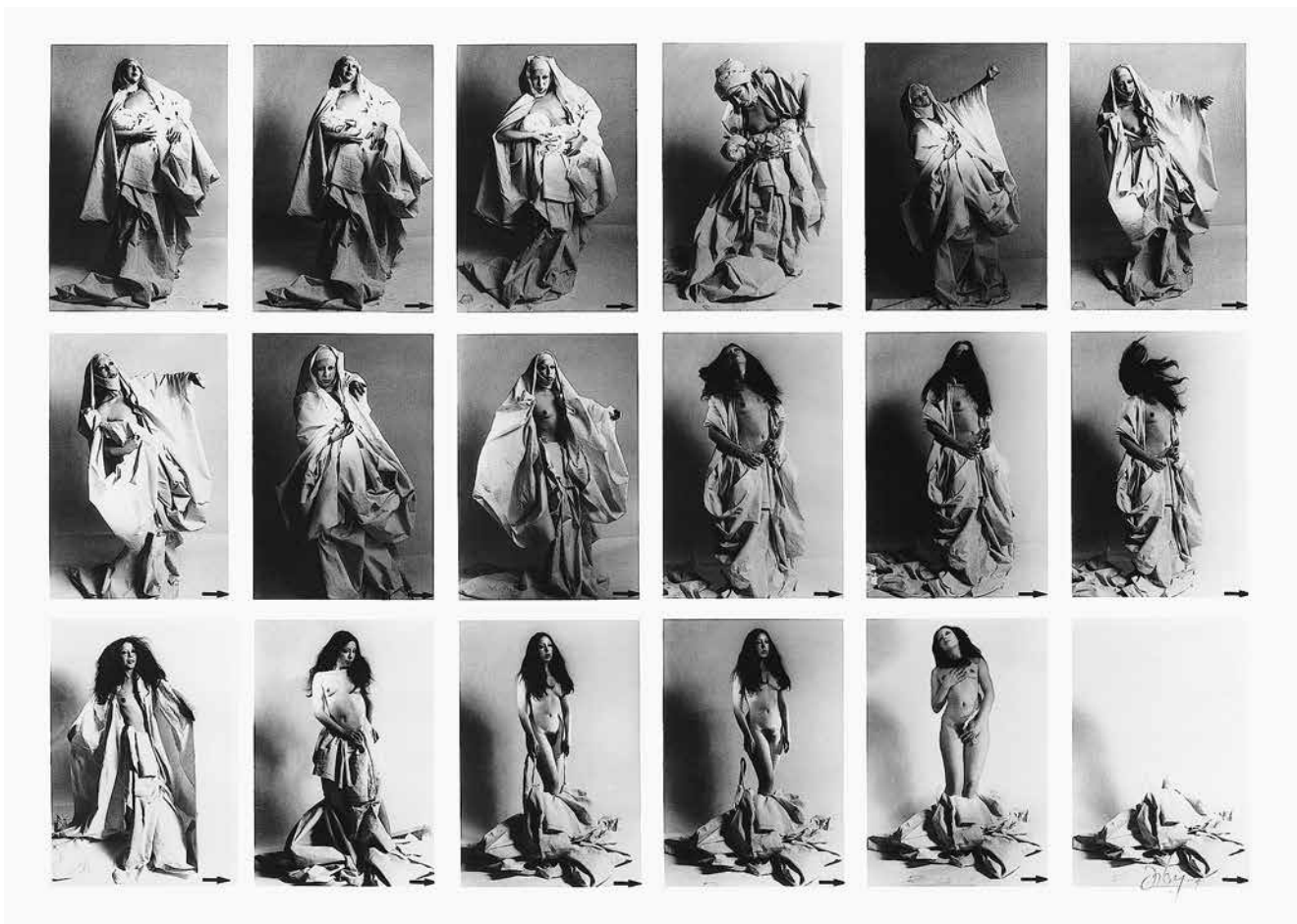
Fig. 3 – ORLAN, Strip-tease occasionnel à l'aide des draps du trousseau , 1974-1975, dix-huit photographies noir et blanc réalisées en 1974 et réunies en une même œuvre en 1975, 44 × 60 cm chacune, Paris, Collection Fonds national d'art contemporain.

qui s'efface pour asseoir la présence de l'artiste. Ce travail se rapproche ainsi de la conception de la lumière du Caravage, dont l'éclairage appuyé des scènes met en lumière la gestuelle des personnages et accuse le contraste avec l'obscurité 27 . La lumière s'engouffre alors dans les plis du drapé rendant compte de sa matérialité et de sa plasticité : elle s'enfonce dans les creux et se reflète sur les surfaces plates, dessinant des lignes de force qui donnent une impression de mouvement effaçant le corps dans la masse du drapé. L'expression corporelle est autant soulignée par la lumière que par les émotions que projette ORLAN sur son visage. Elle peut soit regarder vers la source de lumière comme si elle était en extase, soit afficher un sourire libérateur ou encore un regard vide. Sa gestuelle se trouve accentuée par la lenteur dans la performance ou est alors très expressive dans les photographies. Ses gestes amples évoquent d'ailleurs la posture de la sainte dans L'Extase de sainte Thérèse du Bernin, exécutée en 1647-1652 28 . En effet, elle a la tête légèrement levée vers le haut, ses bras sont en suspension et son corps est presque courbé. ORLAN puise alors dans le répertoire du baroque italien du XVII e siècle pour donner à voir la dichotomie entre la spiritualité et la corporalité, traduite plastiquement par une tension entre la dissimulation du corps par le drapé et la figure emplies de plaisir.