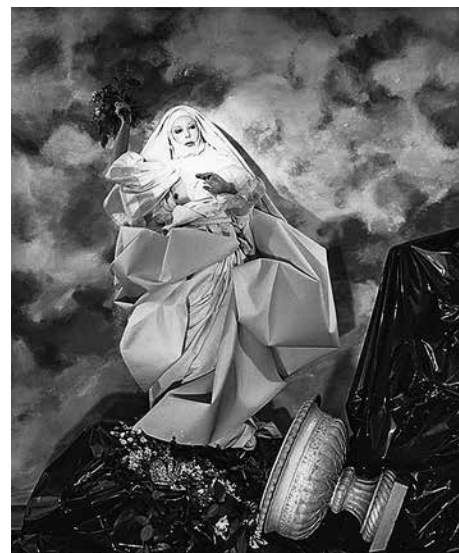
Fig. 6 – ORLAN, Sainte-ORLAN avec Fleurs sur Fond de Nuages , série « Étude documentaire : le Drapé-le Baroque », 1983, photographie en couleur, 120 × 160 cm, prise de vue : Anne Garde, Paris, Collection Fonds national d'art contemporain.

La présence d'un second astre et des angelots, qui sont au nombre de trois, rappelant la Trinité, souligne l'impression que la sainte est en suspension, renforcée par la verticalité de l'installation et par le fait que les autres personnages soient au sol, le thème étant « l'Assomption ». ORLAN ne mentionne pas dans le descriptif les sujets des images diffusées par la vidéo, accordant plus d'importance à leur répétition qui rythme l'œuvre et surtout à leur variété. Cependant, deux éléments de l'esquisse ne sont pas retranscrits dans le descriptif. D'abord, des rayons non-figurés sur le document « devenant des flèches / se précipitant de l'hologramme 40 »