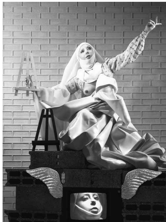
Fig. 2 – ORLAN, Vierge blanche manipulant les objets du culte : chevalet blanc, chevalet noir et montrant son deuxième visage , série « Skaï et Sky et Vidéo », 1983, photographie en couleur, 160 x 120 cm.

Dans ces photographies, ORLAN expérimente plusieurs accessoires différents, comme des croix noires, des croix blanches, des pistolets lasers en plastique ainsi que des petits chevalets blancs et noirs. Ils s'avèrent être des prétextes pour élaborer une perte de sens symbolique, comme l'artiste l'indique dans une conférence en 2009 :