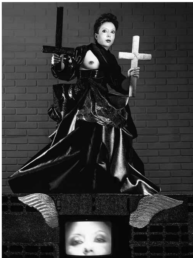
Fig. 1 – ORLAN, Vierge noire manipulant la croix blanche et la croix noire n° 24 , série « Skaï et Sky et Vidéo », 1983, photographie en couleur, 160 x 120 cm.