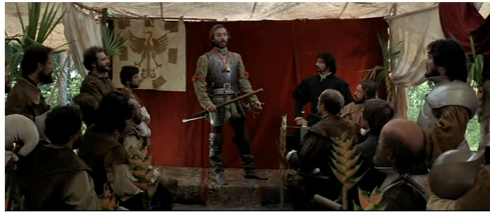
Fig.3. Fernando de Guzmán imita el poder de Felipe II

intentan alcanzarse sin nunca conseguirlo, reflejando así de antemano la búsqueda indefinidamente prolongada de El Dorado 20 , una meta esquivada e inalcanzable por las embarcaciones en el Amazonas. Por otra parte, esta obra interviene también en dos momentos clave de la narración: primero en la coronación de Fernando de Guzmán que lleva la armadura y el bastón de mando, con una actitud y un atuendo calcados del retrato de Felipe II cuyo poder está usurpando (TC: 1h 36mn 19s) 21 . La escritura imitativa de la Recercada ilustra entonces literalmente el relato, cuando Guzmán, copiando el poder imperial, distribuye riquezas virtuales a los nobles que forman su corte. En cambio, en el momento en que el hidalgo Aguirre arrebató el poder declarándose a sí mismo “Príncipe de tierra firme, del Perú y del Chile” (TC: 2h 04mn 04s), parece incómodo en la armadura usurpada y acaba soltando el bastón de mando.