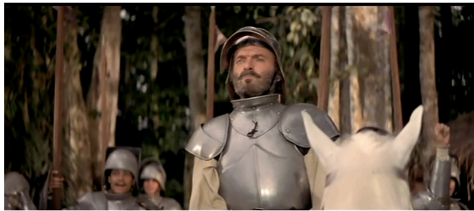
Fig.1. Lope de Aguirre (Omero Antonutti)

Al retratar a Lope de Aguirre, Saura construye un personaje complejo y misterioso que resiste a cualquier interpretación maniquea y cuyas motivaciones permanecen ambiguas entre la rebelión contra la corona española y el ansia de poder que le lleva a la locura. En efecto, si las crónicas históricas de la época de Felipe II lo evocaban como un loco peligroso “traidor, tirano, cruel, asesino, blasfemo, loco, promiscuo” 8 la única explicación posible entonces puesto que el hidalgo se había atrevido a rebelarse contra el Rey de España, en el siglo XX, sin embargo, algunas obras literarias lo retratan por el contrario como precursor de la independencia de América latina 9 .