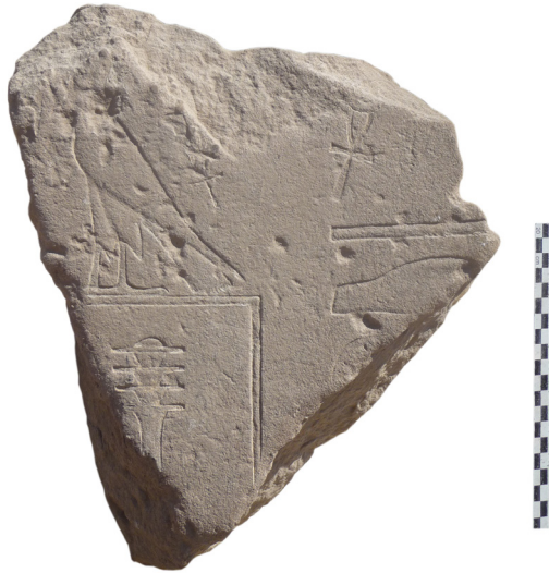
Fig. 1 : Bloc avec le nom d'Horus Dd-[h w ]

appartenir à la maison d'un prêtre contemporain de ce règne.