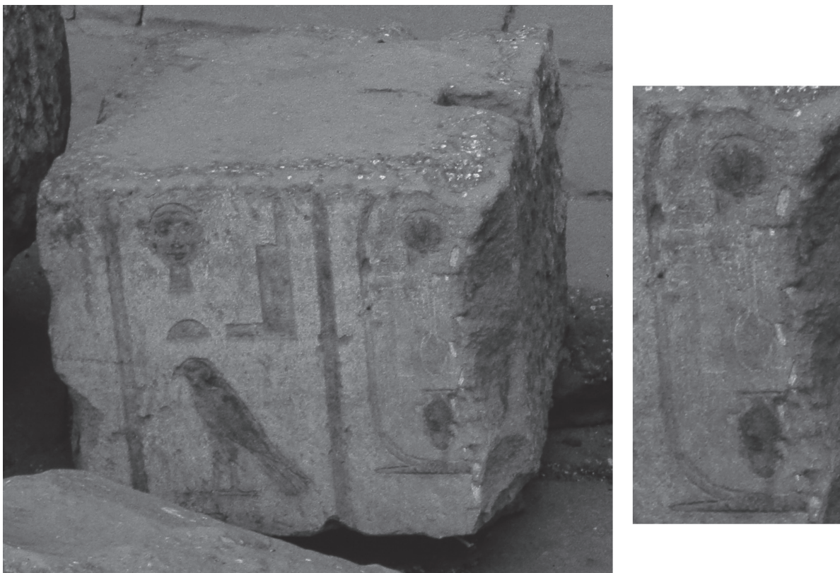
Fig. 3 : Bloc du monument jubilaire d'Edfou avec détail du cartouche royal (d'après une photographie d'archive prise peu après sa découverte).

aussi parfaitement correspondre au début des noms de naissance de Chabaka ou de Chabataka 32 .