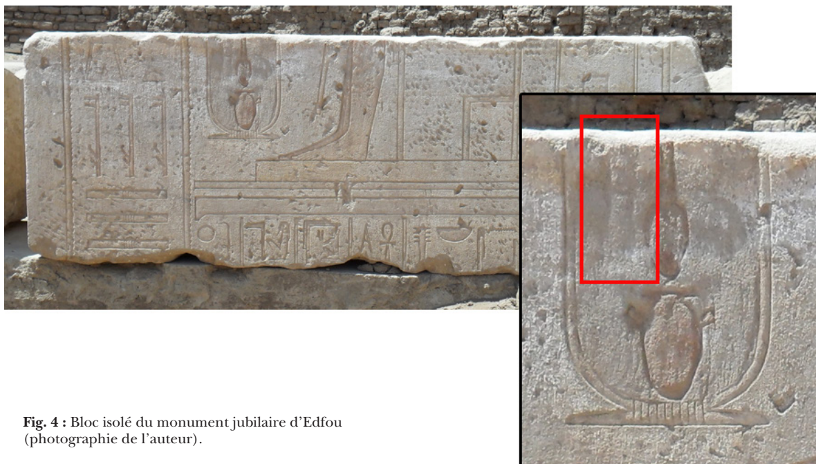
Fig. 4 : Bloc isolé du monument jubilaire d'Edfou.

Dans l'attente d'une publication complète de l'ensemble de cette documentation, cette porte jubilaire pourrait être la preuve que l'œuvre architecturale de Chabataka fut plus importante qu'on ne le pensait jusqu'alors.