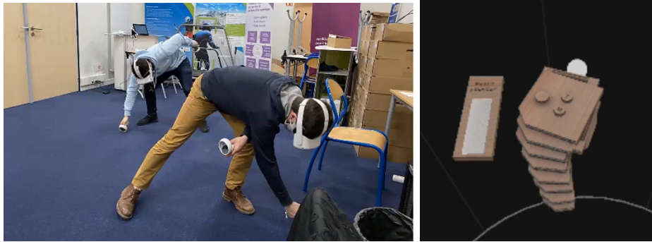
Figure 1. Deux participants dessinant leurs cabanes (à gauche), capture d'écran de la jauge Time to Sketch (à droite)

Les participants avaient dans leur champ de vision une jauge leur indiquant la quantité de "peinture" restante. Quelques exemples de réalisations sont présentés en Figure 2. Chaque participant réalisait la tâche une fois avec la possibilité d'effacer des traits réalisés en cliquant dessus (condition avec effacements ) et une autre fois sans cette fonction (condition sans effacement ). L'ordre des conditions était contrebalancé. Après chaque dessin, ils répondaient à un questionnaire concernant leur ressenti pendant la tâche.