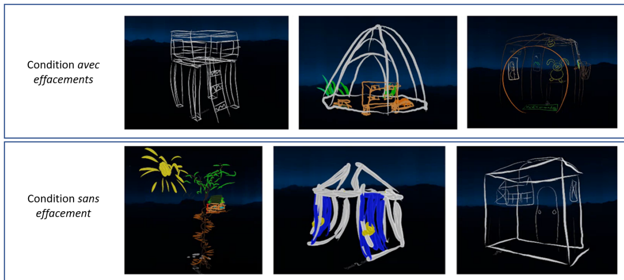
Figure 2. Quelques exemples de cabanes réalisées

Après des tests de Levene pour vérifier l'homogénéité des variances des mesures, les comparaisons de groupes ont été effectuées à l'aide de tests paramétriques pour données appariées ou de tests non paramétriques de Wilcoxon. La Figure 3 montre les moyennes et écarts-types pour les réponses aux questions concernant le ressenti des utilisateurs. Les comparaisons inférentielles indiquent que les différences sont significatives pour ce qui