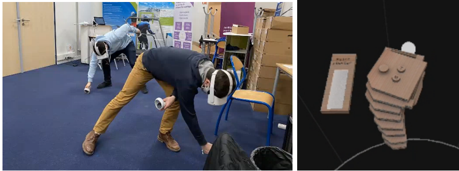
Figure 1. Deux participants dessinant leurs cabanes (à gauche), capture d'écran de la jauge Time to Sketch (à droite)

Les participants avaient dans leur champ de vision une jauge leur indiquant la quantité de "peinture" restante. Quelques exemples de réalisations sont présentés en Figure 2. Chaque participant réalisait la tâche une fois avec la possibilité d'effacer des traits réalisés en cliquant dessus (condition avec effacements ) et une autre fois sans cette fonction (condition sans effacement ). L'ordre des conditions était contrebalancé. Après chaque dessin, ils répondaient à un questionnaire concernant leur ressenti pendant la tâche.