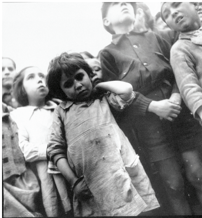
Imagen 140.

Por último, aunque pueda resultar anecdótico, la forma de coger, mirar y encuadrar con esta cámara comporta una relación distinta con lo fotografiado. El gesto del fotógrafo queda más oculto, su trabajo es más discreto, si así lo quiere (la imagen captada por el visor se forma en un cristal horizontal situado en la parte superior, por lo que se observa desde arriba y no llevando la cámara al ojo). Además, hay una facilidad especial para fotografiar a media altura, lo que permite ensayar, sin apenas cambiar la postura, los contrapicados (fotos 96, 104, 138 y 166) 10 . La foto 140 es una demostración de las posibilidades expresivas de este procedimiento. Muestra un grupo de niños tras salir de un refugio antiaéreo en Valencia con la expresión de miedo aún en sus rostros. El contrapicado extremo recorta y confronta a los niños contra el cielo y los “lanza” hacia nuestra mirada para intensificar su expresión y situarnos en una perspectiva insólita, extraña a la visión adulta.