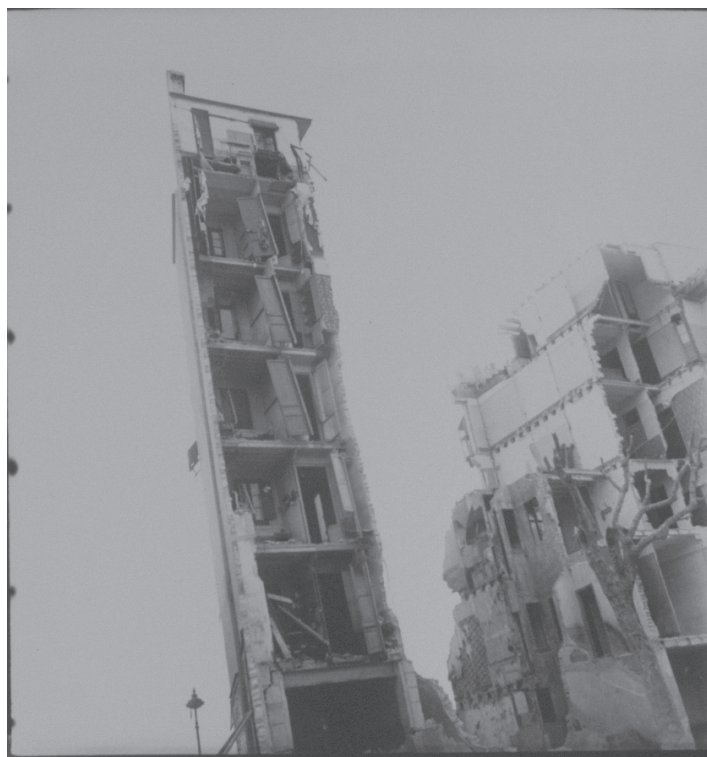
Imagen 148.

Acerca de su conjunto de fotografías de la Academia de San Carlos, hechas en México en 1973, Kati Horna comentaba: “ toda forma está animada por un mensaje mágico. Cada construcción es a la vez que edificio, casa o iglesia, un sueño latente, una actualización de la materia que sin la forma estaría condenada a la nada 13 ”. Se evidencia en esta observación de la fotógrafa una sensibilidad estética especial hacia un aspecto peculiar de los edificios : la relación armoniosa que se suele establecer en ellos entre forma y materia. Para Kati Horna, un edificio no se reduce pues a una funcionalidad como conjunto de viviendas sino que es también el espectáculo puramente visual de una materia hecha forma. En sus fotografías de los espacios urbanos, tanto en París como en España o luego en México, su mirada tiene una acuidad peculiar para, mediante unos enfoques precisos, captar la poesía visual de los edificios, así como el “ sueño latente ” que encierran. En el caso de España, el motivo de las ruinas acentúa esta sensibilidad hacia la relación forma/materia en la medida en que el resultado de los bombardeos rompe su equilibrio armónico. Pero al mismo tiempo, revela de cierta manera su esencia : al haber desaparecido las fachadas, la materia se impone, desnuda. A este respecto, la fotografía n° 148, titulada “ Calle Marina. Bombardeo de marzo ”, sacada en Barcelona después de los bombardeos de marzo del año 1938, es particularmente espectacular.