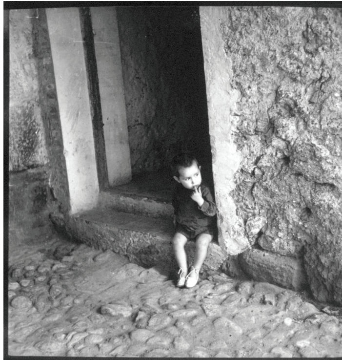
Imagen 33.

La foto 33, “Niño de Vicien”, nos muestra a un niño sentado junto a la puerta de una casa. Los pocos elementos que contiene permiten situar la escena en un ambiente rural. Todo parece respirar un aire de cotidianeidad, de tarde plácida en la que el niño ha decidido asomarse para ver el exterior sin perder la seguridad del umbral. Es precisamente su actitud la que, atravesada por la idea de la guerra, nos induce a leer la curiosidad como inquietud. Su mirada (¿pensativa? ¿atemorizada?) apunta a algo que escapa a la tranquilidad de ese espacio y se desplaza no solo al exterior del lugar, sino a la dimensión temporal.