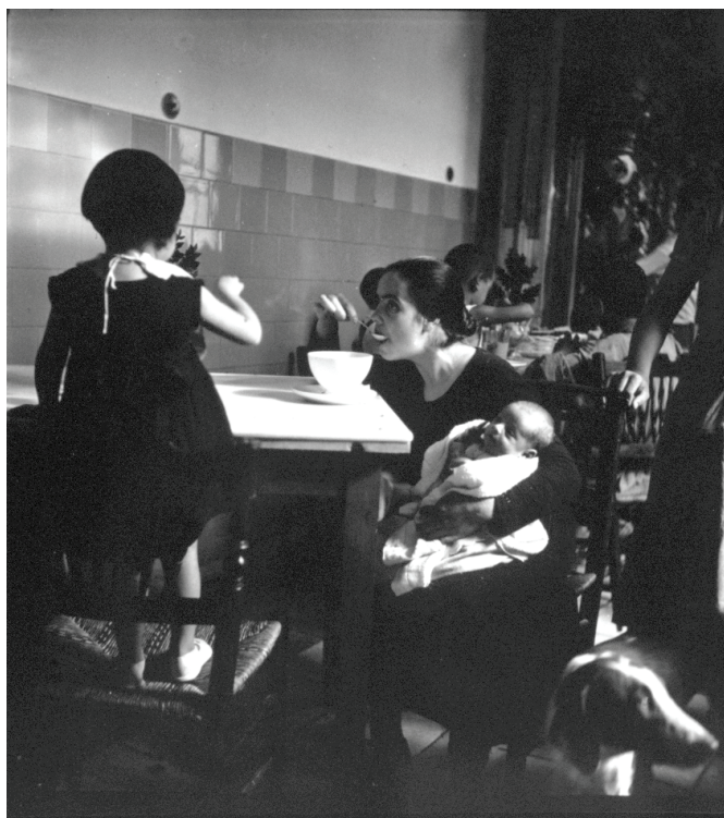
Imagen 105.

En la foto 105, la escena de una madre comiendo junto a la que, suponemos, es su hija podría inscribirse también dentro de una perfecta cotidianeidad. Es más, transmite elementos que sentimos inmutables, consustanciales al celo maternal (esa mirada vigilante de la madre ante el frágil equilibrio de la niña subida en la silla, la protección que ejerce con su regazo al bebé que sostiene). Sin embargo, poco a poco, la foto va revelando ingredientes coyunturales: el vestido negro de la madre, ese bebé que parece desgajado de la atención principal, el entorno que remite a un comedor público, un perro que irrumpe alterando el pacto con el instante preciso y, sobre todo, la ausencia del padre dentro de una composición familiar (¿tal vez muerto o en el frente?). Estamos en un comité de refugiados y la guerra ha dejado sus huellas sembradas en la imagen.