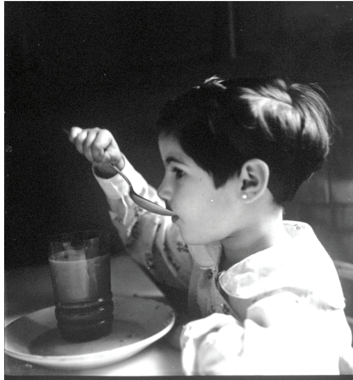
Imagen 112.

En la foto 112 (de la misma serie de la anterior) una niña toma un vaso de leche como haría habitualmente, si no fuera porque está en un centro de refugiados y esa acción adquiere carácter de auxilio. Una niña que ha sido sorprendida con una mirada abstraída (tal vez, más propia de un adulto). Una niña que ha sido fotografiada sola y nunca sabremos si ese recorte espacial (deliberadamente acentuado por un juego de luz/no luz) oculta o no la ausencia de progenitores.