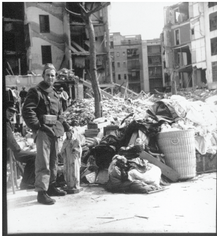
Imagen 144.

antiguos poseedores. Al tiempo, dotan a la topografía urbana de una nueva faz caracterizada por la disolución de la dicotomía: exterior/interior, público/privado. Es más, cobran un valor escenográfico: se solapan, concatenan, amontonan en una perfecta representación del caos. Inútil buscar una cadena lógica en su interior (como en la foto 144).