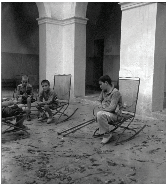
Imagen 162.

La foto 162 nos muestra a unos niños sentados, posiblemente descansando después del juego. El suelo de arena está lleno de garabatos. Uno de ellos lleva un palo en la mano, sin duda ha dibujado con él. Otro tiene unas muletas apoyadas en el suelo. También han debido servir para el juego. Cuando nuestra mirada, después de haber atendido el conjunto, recorre los detalles de la imagen y sigue el itinerario que va de las muletas hacia el niño, descubrimos que le falta una pierna. Entonces, el juego revela una trágica amputación, una violenta irrupción del mundo adulto. La guerra está inscrita en la imagen, pero ya con otra temporalidad. Es, como indicábamos más arriba, el tiempo de lo cotidiano cortocircuitado, segado, donde aún late con fuerza el acontecimiento.