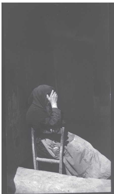
Imagen 55.

La foto transmite oscuridad... en pleno día; un día soleado. La fotógrafa ha rebuscado entre los rincones, ahora del pueblecito de Vicien, para “descubrir” a esta anciana en su hábitat natural, sin forzar la presencia, sin extirpar nada. Quizá repose la mujer en el interior de su hogar, enmarcada por el dintel de una descomunal ventana que deja franco el camino a la mirada; o tal vez sea un murete ubicado en cualquier lugar del poblado. La silla es perceptible, a diferencia de aquélla recubierta de la foto 32; una de esas austeras sillas de enea trenzada, maderas descoloridas, patas que cojean. Sayón largo, velo protector, vestido negro... Una mano, apenas perceptible, se apoya en el respaldo; sobre ella, el codo del brazo derecho asciende hasta advertir la otra mano que protege el rostro.