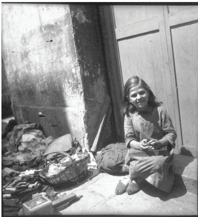
Imagen 129.

La foto 129 retrata a una niña sentada en una calle del barrio chino de Barcelona. Junto a ella se acumula un reguero de harapos y cachivaches. El montón de cosas se prolonga más allá del encuadre, como si fuera una inmensa hilera de material de desecho, restos del naufragio a los que la niña, con su presencia, parece dotar de orden, sentido. La composición abre numerosos interrogantes: ¿juega con ellos? ¿Los vende? ¿Vive en la calle? En todo caso, su mirada alegre a cámara, su pelo recién peinado (lo sabemos porque lo hemos visto en la foto anterior), componen una vitalidad que la elevan más allá de ese paisaje desolado (invocación de los desastres de la guerra).