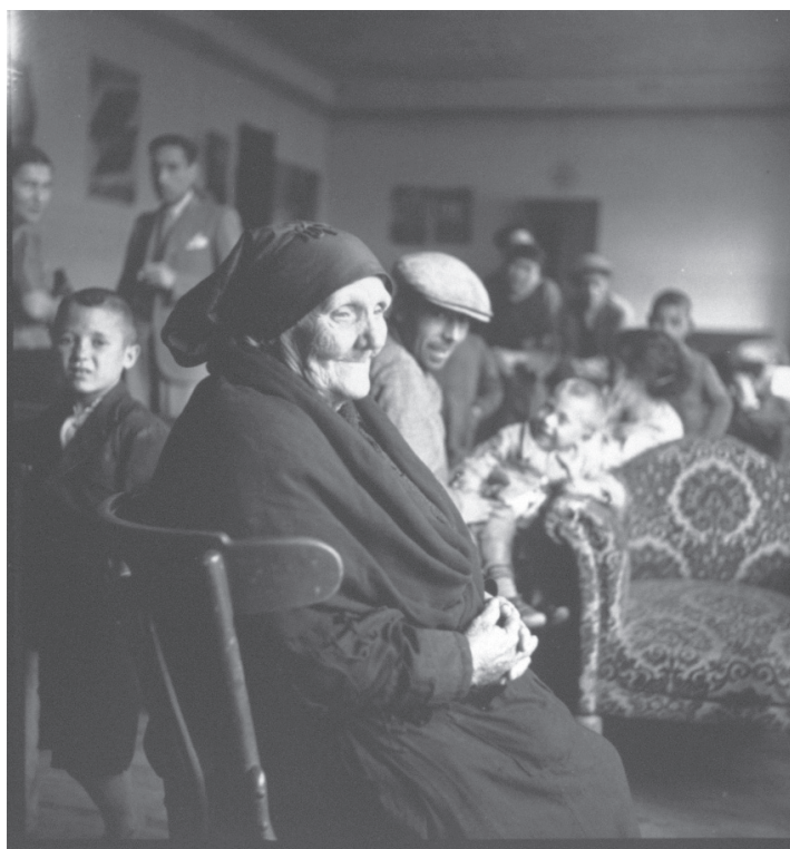
Imagen 107.

El fagonazo ha despertado a todos del letargo. El niño de la izquierda mira extrañado, con el veloz movimiento reflejo que su edad le otorga y que ha chamuscado su mueca; el hombre de la boina se gira en ese preciso instante (o así parece), sin variar la inclinación de su cuerpo que abre una sugerencia a lo que estaba haciendo segundos antes; dos figuras masculinas, una de ellas elegantemente ataviada y fumando, departen sin desatender el acto fotográfico. Al fondo de la imagen, aunque difuminados por la indiferencia del foco, una familia posa y nos contempla. Diríase que éstos son los únicos que aguardaban el disparo y en cambio son justamente los que la cámara desprecia.