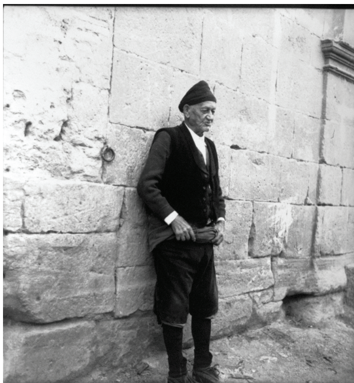
Imagen 20.

Esa fijación de lo permanente, de lo inmemorial antes expuesta podría estar representada por la foto 20. Titulada “Campesino aragonés”, compone una estampa propia de los pioneros de la fotografía. Podría ser una foto de Charles Clifford o de Jean Laurent (aquellos fotógrafos viajeros que fijaron diversas escenas tradicionales de la España del siglo XIX), si no fuera porque sabemos que está hecha, inscrita en el tiempo de la guerra. Por más que ese anciano, apoyado en ese muro secular, nos traslade con su porte a un universo ancestral, inmutable.