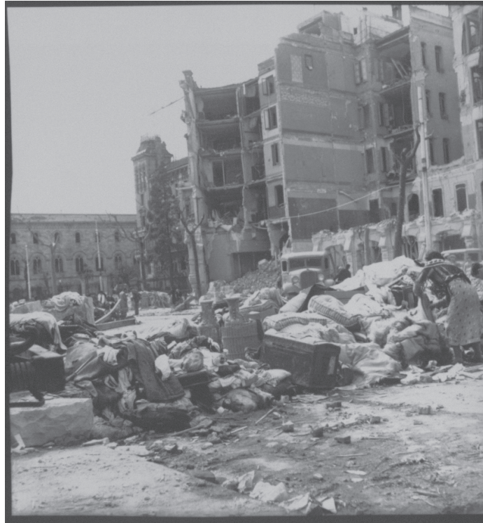
Imagen 179.

si rehúye voluntariamente de cualquier representación de la violencia en acto, no por ello es ausente la violencia de sus fotografías. En efecto, se presenta en ellas mediante una función metonímica que se asienta en un arte de la metalepsis, una figura retórica que suele expresar la causa por la consecuencia, y viceversa. El espectáculo de las ruinas presentes se concibe entonces como la consecuencia de los bombardeos pasados que las imágenes designan in absentia . Observemos, por ejemplo, la fotografía n° 179 titulada “ Casas bombardeadas ” (sin fecha, sin lugar), muy parecida a la anterior, por la manera en que se estructura en ella el espacio fotográfico, dividido en una parte inferior (el de la calle) y una parte superior (los edificios) que el tipo de encuadre elegido, en gran plano, permite abrazar conjuntamente.