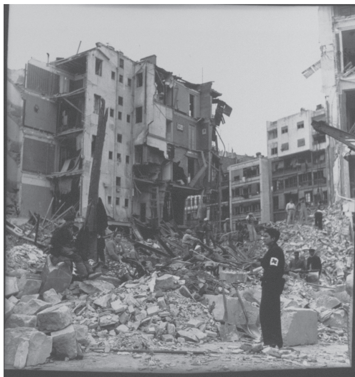
Imagen 196.

La calle, teóricamente destinada a la circulación, pierde su función natural, obstruida por unos escombros amontonados al lado de los cuales las dos palas del primer plano parecen irrisorias. Un igual sentimiento de irrisoriedad se desprende de la decena de figuras humanas presentes en la fotografía, que parecen fundirse en el campo de ruinas. La parte inferior de la fotografía evidencia una ciudad “desarquitecturada”, cuyos fragmentos, recuerdos abstractos de lo que pudo ser, adquieren funciones insólitas: de tal tronco mutilado cuelgan ahora chaquetas, y tal piedra, que pertenecería antaño a un sólido edificio, sirve de asiento. En la parte superior, a la derecha, se alza, contrastando con la horizontalidad del campo de ruinas, un edificio cuya frágil verticalidad cierra el siniestro espacio. Al igual que la calle, ha perdido su función principal de preservación de la intimidad: la antigua racionalidad urbana (recordada por los restos arquitectónicos), fundamentada en una clara distribución del espacio entre lo interior y lo exterior, queda del todo abolida. Esta fotografía, como la mayor parte de la serie, deja constancia de las consecuencias materiales del arte nuevo de hacer ruinas sobre la topografía de la ciudad. Pero en la mirada de Kati Horna, las imágenes de las ruinas no se reducen a esta primera dimensión testimonial.