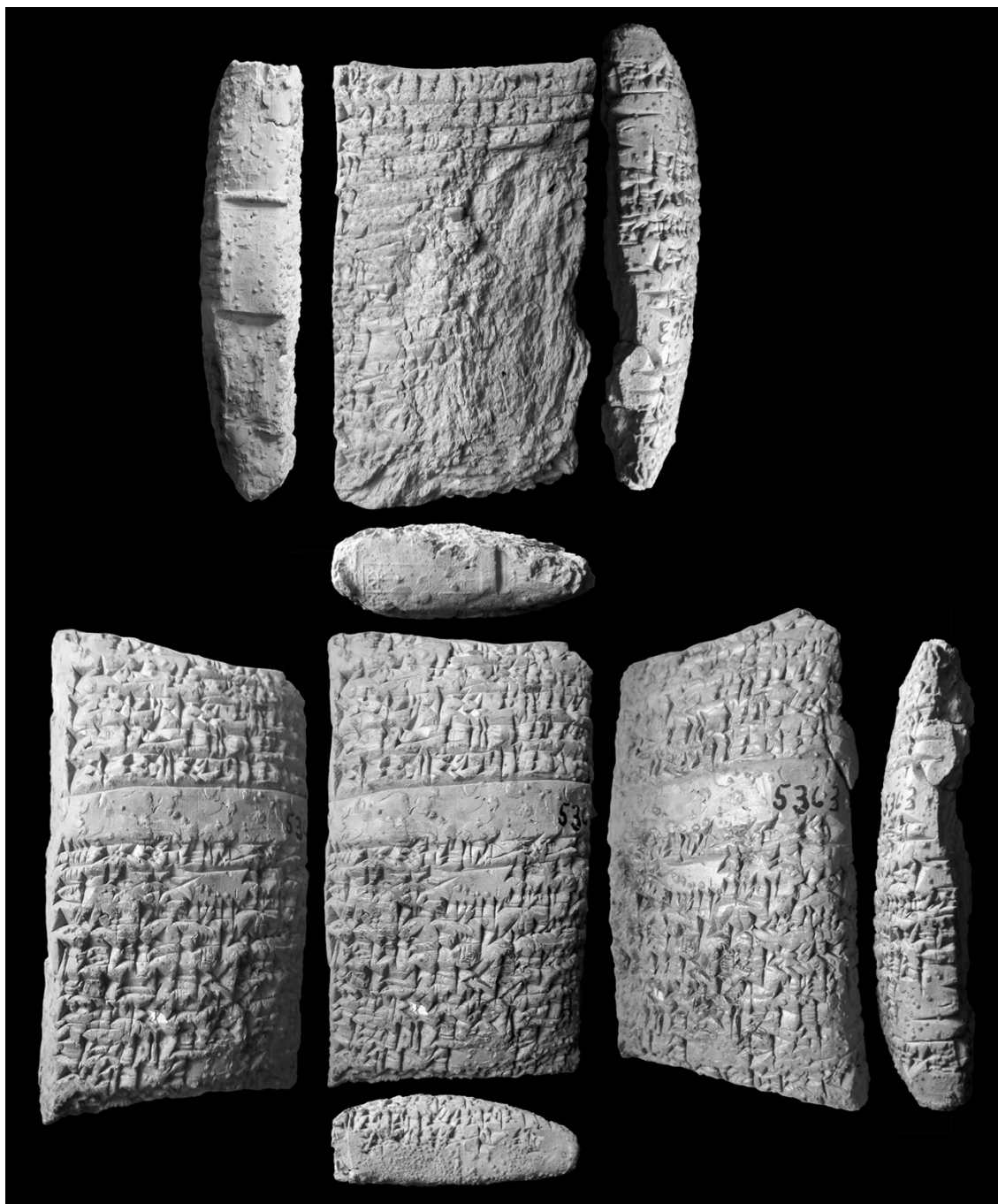
Fig. 1. La tablette YOS 5 149.

MU INIM AN d EN.LÍL d EN.KI.GA.TA 24 i UD.KIB.NUN.NA TI.IGI.DA KÙ.GA d ŠE[Š.KI] NESAG TUM 4 É.KUR.ŠÈ ÈŠ NAM.TILA.N[I.ŠÈ] 26 SIPA ZI d ri-im- d EN.ZU.E KI UNU ki! ZÀ A.AB.ŠÈ 28 MU.UN.BA.AL.LA GÚ.BI.TA GÁN DAGAL.LA. BÍ.IN.NE.[...] T.30 A DA.RÍ ŠEŠ.UNU ki .MA.ŠÈ IM.MI.IN.GAR.RA