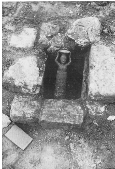
a. The Enki Temple of Rim-Sin; the foundation deposit