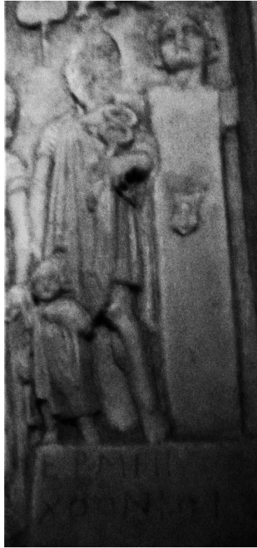
Fig. 2 : Représentation d'Hermès avec base inscrite sur la stèle de Véria. Musée de Véria, photo personnelle.

dédier une construction funéraire « à Hermès Chthonios » entre en dialogue avec deux formes ou apparences du dieu, du fait que la base inscrite les soutient toutes deux : ils me semblent complémentaires, comme pour former une séquence à la fois iconographique et onomastique où Hermès est Chthonios , psychopompe et quadrangulaire. Chaque élément est distinct, mais l'ensemble forme un dieu pluriel, à l'instar d'une séquence onomastique comme Hermès Katochos kai Dolios kai Chthonios kai Eriounios . Hermès Chthonios n'apparaît pas tant dans un environnement « infernal » que dans un paysage religieux, funéraire.