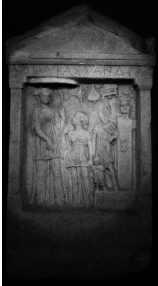
Fig. 1 : Stèle funéraire de Cassandra, fille d'Hadéa, Veria, époque hellénistique. Musée de Véria, photo personnelle.

Sur le relief, à gauche, deux femmes, une adulte et une jeune fille, se font face : elles sont sans doute la défunte et sa mère, nommées dans l'inscription. À droite, une base rectangulaire inscrite « à Hermès Chthonios », supporte deux représentations du dieu (Fig. 2) : Hermès anthropomorphe, vêtu de la chlamyde et portant le caducée, avec à sa droite une petite figure anthropomorphe enveloppée dans un manteau long ; à sa gauche se dresse un Hermès quadrangulaire. Cette inscription figure sur d'autres exemples en Thessalie. 118 Le nom du dieu qui semble