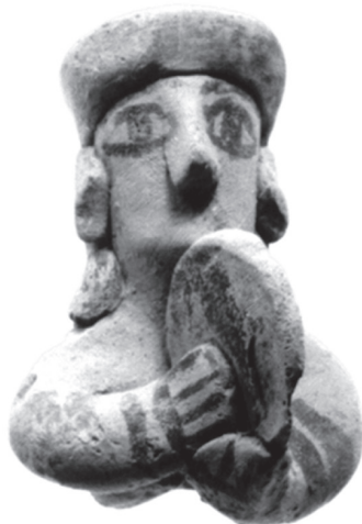
Fig. 5 – Figurine de Pyrga (atelier d'Idalion), Cyprus Museum CS 1684, H. 6,5 cm.