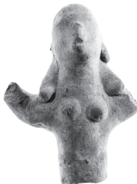
Fig. 6 – Figurine de Paphos, Paphos District Museum, inv. 853/2, H. 8,5 cm.