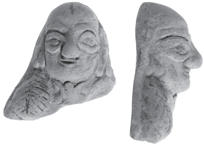
Fig. 11 – Figurine moulée en plaquette d'Amathonte, acropole, Limassol District Museum inv. AM 2613, H. 5,8 cm.

Le premier exemple est emprunté au répertoire de Paphos. On a vu plus haut que les ateliers paphiens ont fabriqué des figurines modelées en plein dont le style (et ses ressorts techniques) sont tout à fait caractéristiques (fig. 6). Cette production entre, par les gestes qu'elle privilégie, dans le groupe de la technique du bonhomme de neige mais, à la différence des autres ateliers qui utilisent cette technique, les artisans de Paphos ne se contentent pas de mettre grossièrement en forme le boudin de pâte qui figure la tête (en l'aplatissant légèrement, comme à Amathonte, ou en accentuant le diamètre du front, comme à Kourion) : ils travaillent aussi le visage pour rendre en volume les traits (ressaut de l'arcade sourcilière, renflement des orbites). Il est tentant de voir dans ce geste de modelage dans la pâte (et non