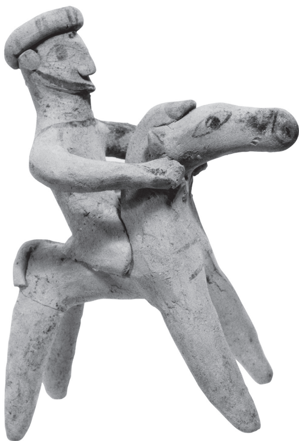
Fig. 9 – Figurine de Kition, Larnaka District Museum inv. 1285bis, H. 20 cm (© Département des Antiquités de Chypre).