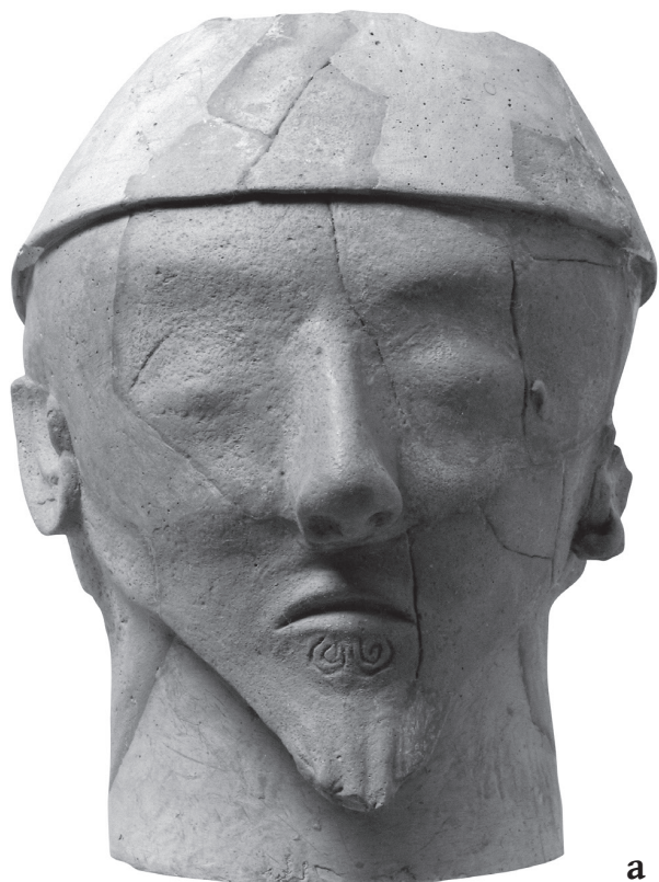
Fig. 3 – a. Statuette d'Agia Eirini modelée en creux (atelier de Soloi), Medelhavsmuseet, Stockholm, inv. A.I. suppl. 2794, H. 20,2 cm ; b. Statuette de Salamine-Toumpa moulée en creux, Cyprus Museum inv. C 111, H. 13,2 cm.