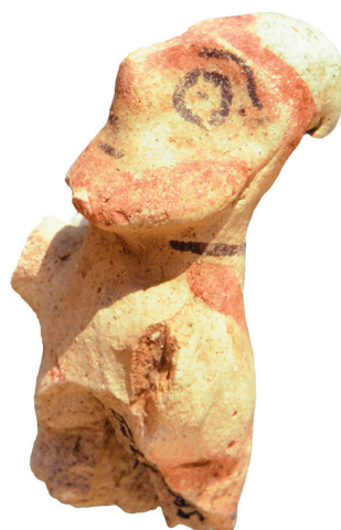
Fig. 8 – Figurine de Salamine, fouilles françaises, inv. Sal. 7789, H. 8 cm (© archives de la mission archéologique de Salamine).