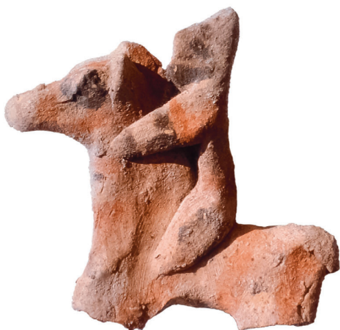
Fig. 7 – Figurine de Salamine, fouilles françaises, inv. Sal. 201, H. 8 cm.