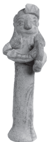
Fig. 4 – Figurine d'Amathonte, dépôt près du rempart Nord, Limassol District Museum inv. AM 2601, H. 6,5 cm (© École française d'Athènes, Ph. Collet).