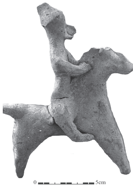
Fig. 10 – Figurine d'Agios Thérapon-Silithkia (atelier de Kourion), Limas- sol District Museum, inv. 241/6, H. 15,9 cm.