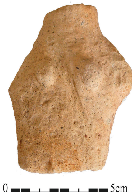
Fig. 2 – Figurine moulée de Kition-Bamboula, XII e s. av. J.-C., Larnaka District Museum inv. KEF-1429, H. 8,3 cm (© Mission archéologique de Kition).