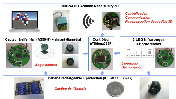
FIGURE 1 : Autopsie d'un composant moléculaire de l'interface tangible. Les événements à détecter à l'aide de méthodes sans contact, sont les connexions/déconnexions entre les composants, réalisé à l'aide d'un protocole infrarouge (led et récepteur infrarouge), et les angles entre les composants, grâce à un système d'aimant radial et de capteur à effet Hall. Ces données d'évènement sont transmises sans fil à un Arduino Nano qui centralise ces données et les communiquent à l'interface graphique

conçu et développé une interface tangible sans marqueur et sans fil [5] basée sur l'Internet des Objets (voire Figure 2) pour construire un jumeau virtuel d'un modèle physique moléculaire modulaire [1] à l'image de pièces de Légo, et articulé (voir Figure 3).