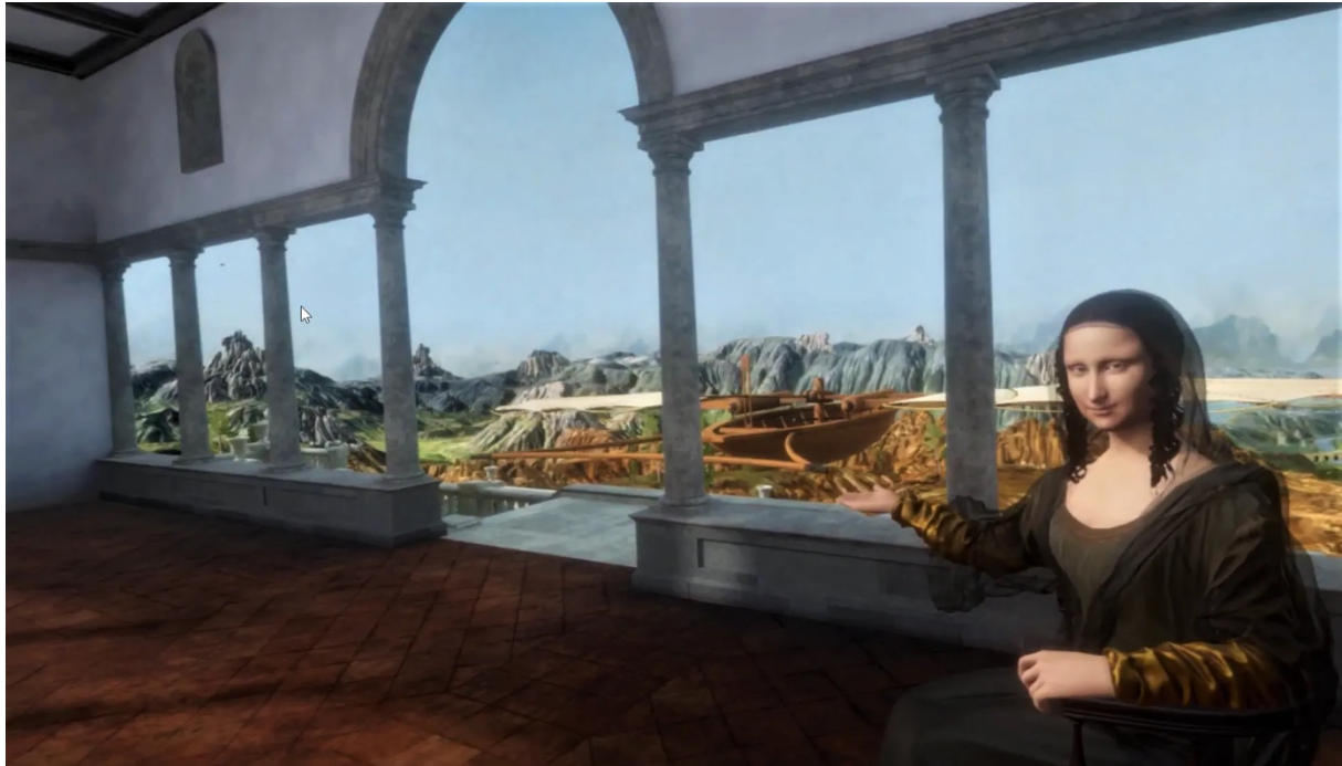
Illustration 3. Capture d'écran de l'expérience en réalité virtuelle Mona Lisa, Beyond the Glass, 2019

Ainsi, utiliser un casque de réalité virtuelle pour appréhender une peinture réalisée dans une forme close est une négation de la forme réelle du tableau, et altère profondément l'expérience esthétique qu'elle propose. Du reste, la réelle motivation derrière tout ce dispositif n'est pas de renouveler l'expérience du célèbre tableau, mais d'éviter son déplacement physique, fort coûteux, hors de la Salle des États où il se trouve habituellement. Le Louvre, pour ne pas avoir à intégrer La Joconde à l'exposition De Vinci, s'est donc rabattu sur ce dispositif.