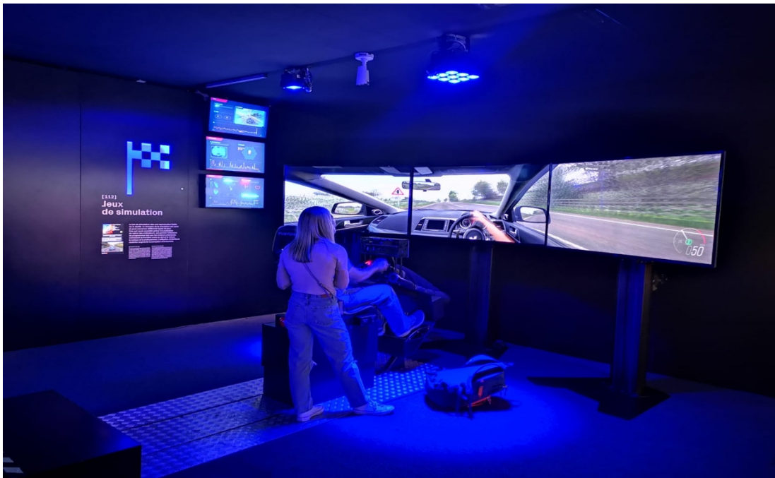
Illustration 5. Dans le E-Lab de la Cité des Sciences et de l'Industrie, à la Villette