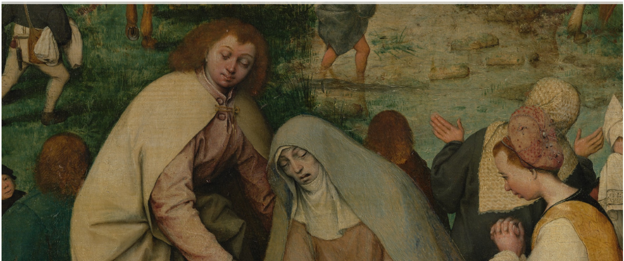
Illustration 2. Détail du Le Portement de Croix , Brueghel, macrophotographie digitale

L'immersion, comme nous l'avons dit, est d'abord un phénomène marketing fonctionnant comme un argument de vente pour le jeu vidéo. Ce critère se retrouve transposé mécaniquement dans les musées d'art qui donnent à voir des peintures, ce qui n'est pas sans dommage pour l'expérience des œuvres. La grande exposition De Vinci de 2019, qui proposait à son terme Mona Lisa : Beyond the glass , une expérience immersive où l'on pouvait choisir d'avoir accès à diverses informations sur le tableau, comme dans un jeu vidéo éducatif, en est un exemple. Nous nous garderons bien ici de toute essentialisation de la peinture 25 , mais il est important de souligner les problèmes engendrés par un culte de l'immersion appliqué aux peintures. Le fait que nous ayons accès à une version numérisée de La Joconde au sein de l'exposition pour préserver l'original, ne pose en soi aucun problème. La numérisation peut d'ailleurs nous faire accéder à un luxe de détails particulièrement enthousiasmant, comme l'illustre le cas des œuvres de Brueghel, numérisées et rendues disponibles par le musée d'art de Vienne 26 . Le zoom, que l'on peut pousser à l'extrême, permet de pallier les faiblesses de nos yeux et d'accéder à des détails secrets des tableaux. L'expérience rappelle l'entreprise d'Arasse dans son essai Détail. Pour une histoire rapprochée de la peinture . Pour Arasse, le détail permet en effet de faire émerger un sens nouveau et de reprendre à nouveaux frais l'analyse d'œuvres trop connues 27 .