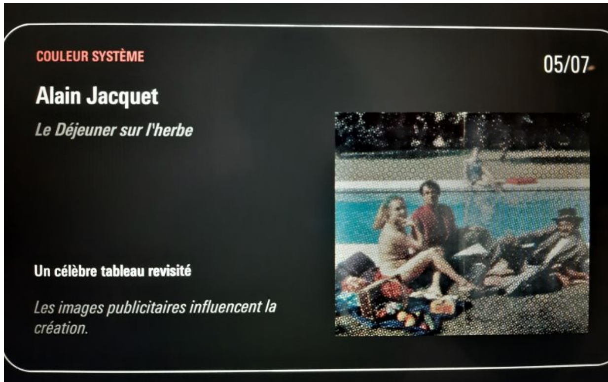
Illustration 4. Capture d'écran du jeu Prisme 7 , 2020

pièces à collectionner ne nous aide pas à les comprendre, à nous intéresser à leur histoire. Nous pouvons prendre l'un des exemples du jeu : l'œuvre d'Alain Jacquet est une reprise évidente du Déjeuner sur l'herbe de Manet, mais la description est bien trop brève et vague pour saisir les enjeux de cette reprise, ramassée dans deux phrases très générales : « un célèbre tableau revisité. Les images publicitaires influencent la création ».