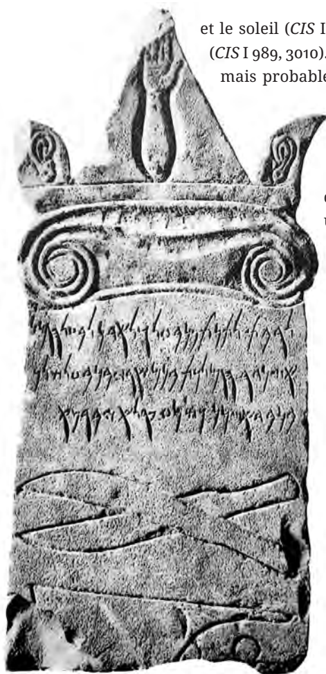
Figure 4 — Stèle fragmentaire. Musée National de Carthage. D'après CIS I 5704 , pl. C.

et le soleil ( CIS I 4062 ) ou une figure probablement divine debout ( CIS I 989 , 3010). Comme on vient de le voir, un personnage debout, mais probablement humain, était représenté à côté de l'oreille