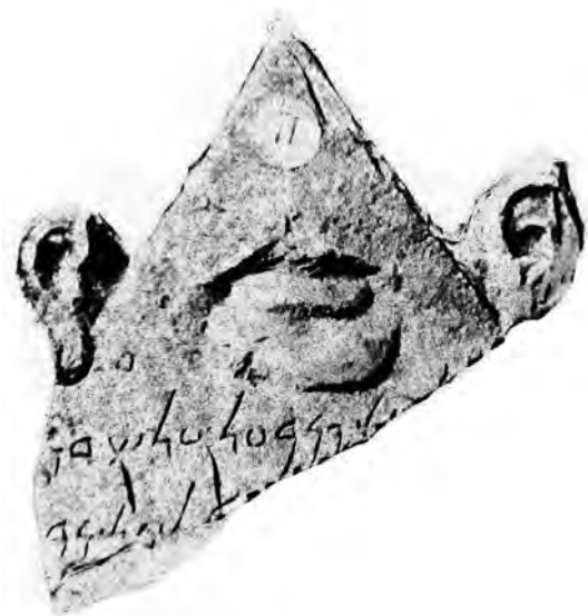
Figure 1 — Stèle fragmentaire. Musée du Louvre, AO 23389. D'après CIS I 1020, pl. XIV.

affaire à une paire d'oreilles, mais à une seule oreille. Sur la première (CIS I 4764 ; fig. 2), une oreille est représentée sur le fronton à côté d'une palme, alors qu'il n'y a pas d'oreilles dans les acrotères. Sur l'autre stèle 78 , très abîmée, dans ce qui en était probablement le fronton 79 est représentée une grande oreille, à laquelle un personnage debout semble adresser sa prière (fig. 3).