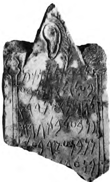
Figure 2 — Stèle fragmentaire. Musée National de Carthage. D'après CIS I 4764, pl. XXX.

Ces représentations d'oreilles sur les stèles ont généralement été interprétées comme une référence à la possibilité de se faire entendre par les dieux, une déclaration de foi dans leur disponibilité à écouter ou un témoignage du fait qu'ils avaient écouté et exaucé les requêtes qui leur étaient adressées. Pour la stèle d'El-Hofra, on a avancé une interprétation différente, en vertu de