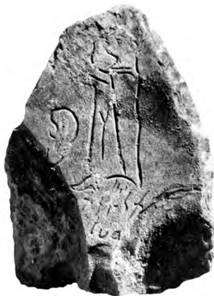
Figure 3 — Fragment de stèle. Musée National de Carthage. D'après Bisi 1966, pl. LV.