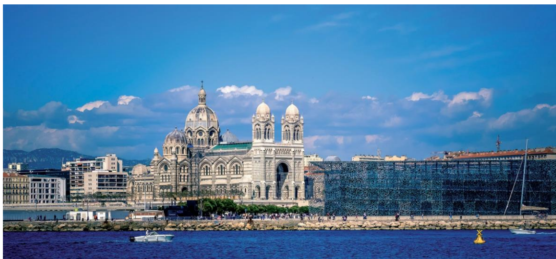
ill. 2 : Mucem et front de mer de Marseille.

parfois autoritaires et dispendieuses 20 . En fait, le mythe de la ville créative faisant table rase du port de pêcheurs et les représentations nouvelles des touristes s'opposent et se disloquent dans des moments éphémères de fêtes populaires ou gâchées par des bilans comptables incompréhensibles 21 . Ce dialogue urbanistique et paysager entre le Vieux-Port et les nouvelles infrastructures du front de mer implique des mutations 22 , comportant de nombreux risques liés à la venue par millions de touristes dans un tissu social fragilisé par la crise économique. La difficile conciliation entre tourisme et vie locale fait apparaître de nouvelles tensions sociales.