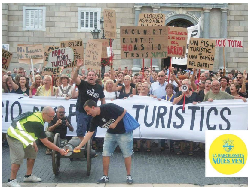
Manifestation devant la mairie de Barcelone avec des pancartes « La Barceloneta n'est pas à vendre – Un appartement touristique = une famille du quartier en moins »

Le fait de demander au maire la fermeture des appartements de location de vacances non déclarés ne change pas la tendance lourde de ce quartier à subir une détérioration morale et économique avec la disparition des boutiques traditionnelles, remplacées par des supérettes, bars et des espaces publics de plus en plus sales. La destruction du tissu social ancien est au cœur des interrogations des manifestants, qui demandent une mixité plus grande, et une montée en gamme des offres touristiques, tout en dénonçant l'incapacité d'un maire jugé comme faible et peu inventif pour remédier à ces problèmes et surtout à la masse, au flot quasi ininterrompu, tout au long de l'année, de jeunes Européens qui viennent faire la fête à Barcelone. Une vie de quartier se meurt malgré des initiatives pour renforcer les liens entre les habitants, comme par exemple la « semaine baroque de la Barceloneta », au cours de laquelle les habitants se déguisent et donnent une autre image du quartier.