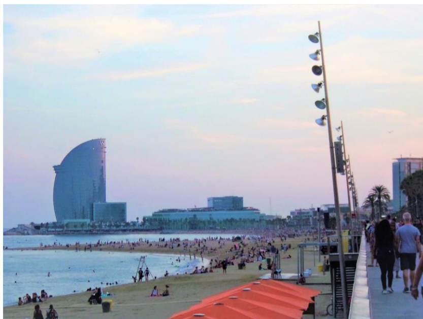
ill. 1 : Port et plage touristique de Barcelone. Photographie de Patrice Ballester (2015).

Concernant Marseille, l'opération Euroméditerranée couplée à l'organisation de la Capitale européenne de la culture en 2013 impose de fait une nouvelle image de la ville, dynamique et accessible avec un réseau LGV de qualité et l'axe Paris-Lyon-Marseille renforcé 15 . La ville consolide son image et des représentations positives lui sont associées à travers par exemple le classement parmi les trois destinations françaises préférées des internautes par le site TripAdvisor en 2014. La cité phocéenne devient une des quatre métropoles les plus demandées sur les recherches des internautes 16 . En 2014, Marseille, dépassant Naples, devient le cinquième port de croisière de Méditerranée, après Barcelone, Civitavecchia, Venise et les îles Baléares.