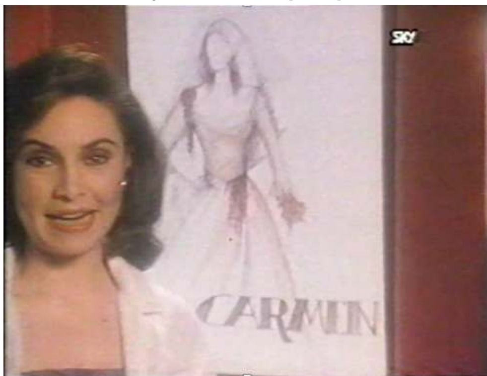
Capture d'écran, Campagne Spain, everything under the sun , 1989.