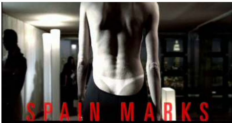
Capture d'écran, Campagne Spain marks , 2002-2003.

Fêtes de Pampelune, les San Fermín , des pieds meurtris par le chemin de Saint-Jacques, une dent cassée par la dégustation d'un crustacé, des cheveux coupés dans le style des Ménines de Velázquez ou encore une marque de lingerie laissée suite à une exposition au soleil.