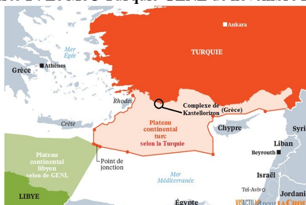
Carte 1 : Le MoU Turquie-GENL de novembre 2019