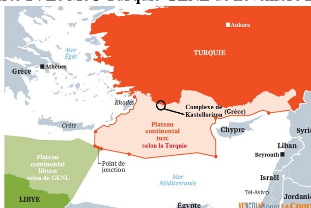
Carte 1 : Le MoU Turquie-GENL de novembre 2019