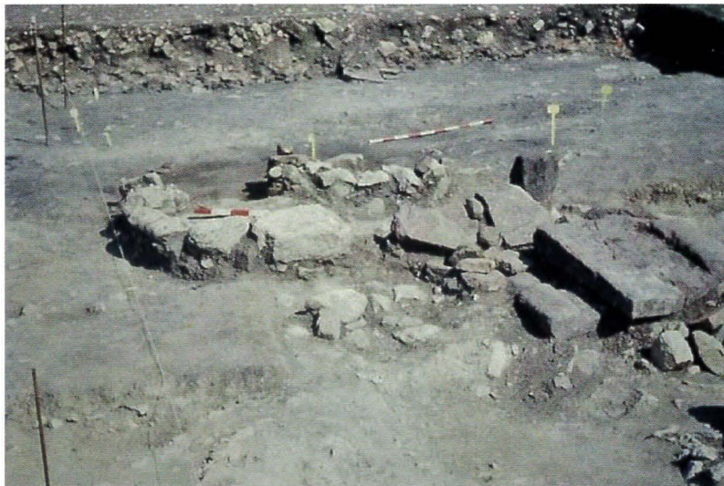
Foyer du IV e siècle dans la cour du bâtiment résidentiel.

La villa a été repérée la première fois en 1861 par le pasteur Jean Ringel qui entreprend des fouilles sur les parties résidentielle et agricole. Les murs mis au jour sont relevés et reportés sur des maquettes en plâtre,