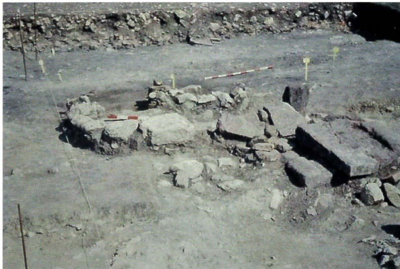
Foyer du IV e siècle dans la cour du bâtiment résidentiel.