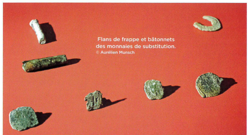
Flans de frappe et bâtonnets des monnaies de substitution.

celui à l'est a été fouillé exhaustivement, sont face à face autour de la cour de la pars rustica . Le dernier au fond de cette cour pourrait être interprété comme un potentiel grenier. Les fouilles menées sur l'édifice oriental ont révélé plusieurs phases de construction. Lors de la première, dans la seconde moitié du I er siècle de notre ère, le bâtiment sur fondations maçonnées de forme rectangulaire ne possède qu'une seule pièce. Il est remplacé rapidement dans une deuxième phase par un bâtiment plus vaste, doté d'une grande pièce encadrée par deux plus petites en enfilade. Ultérieurement,