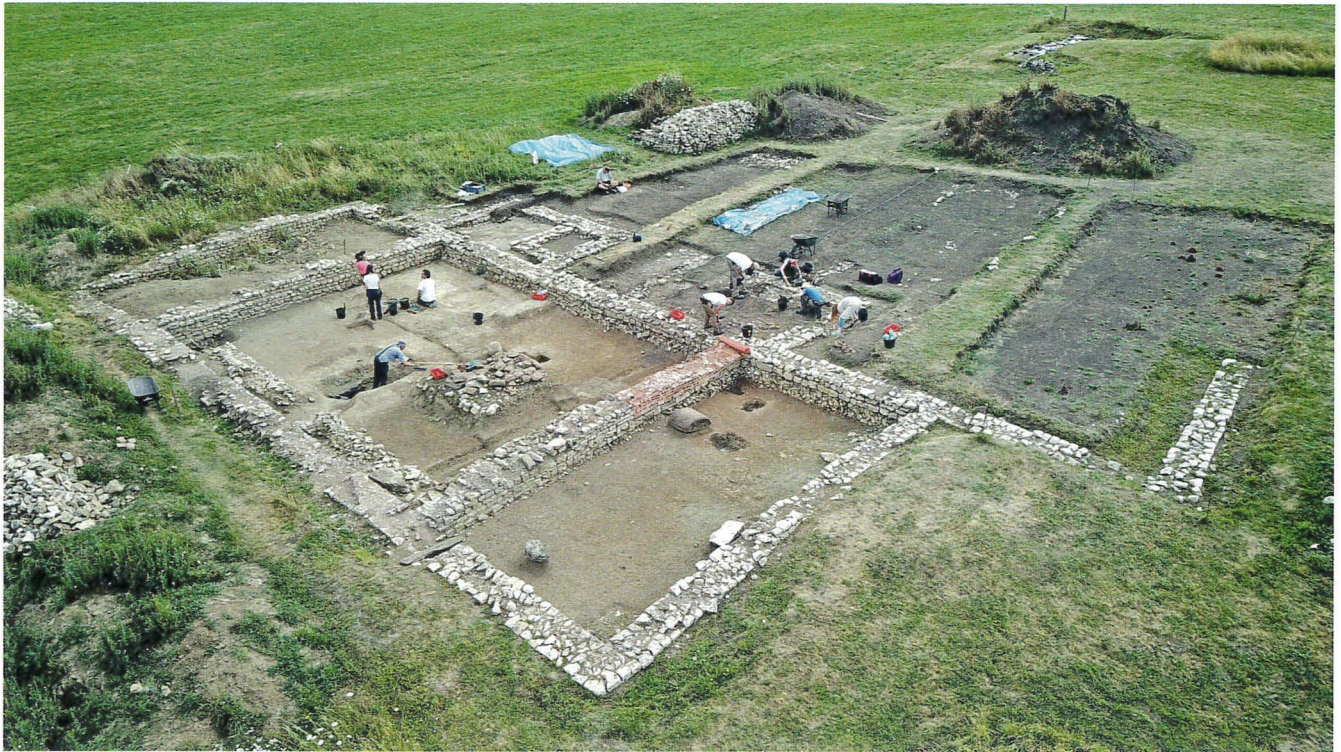
CI-DESSUS. Bâtiment agropastoral en cours de fouille.