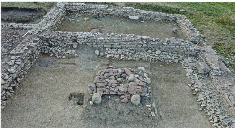
Aire de bronzier.

de nombreuses graines ont été retrouvées (en cours d'étude). Au début de l'Antiquité tardive, le bâtiment est restructuré, la villa semble perdre son statut et redevient une simple ferme, où l'occupation ne se retrouve que dans la cour autour d'un foyer daté du IV e siècle, accompagné d'un probable bâtiment en matériaux périssables. La maison est totalement abandonnée dans le premier quart du V e siècle.