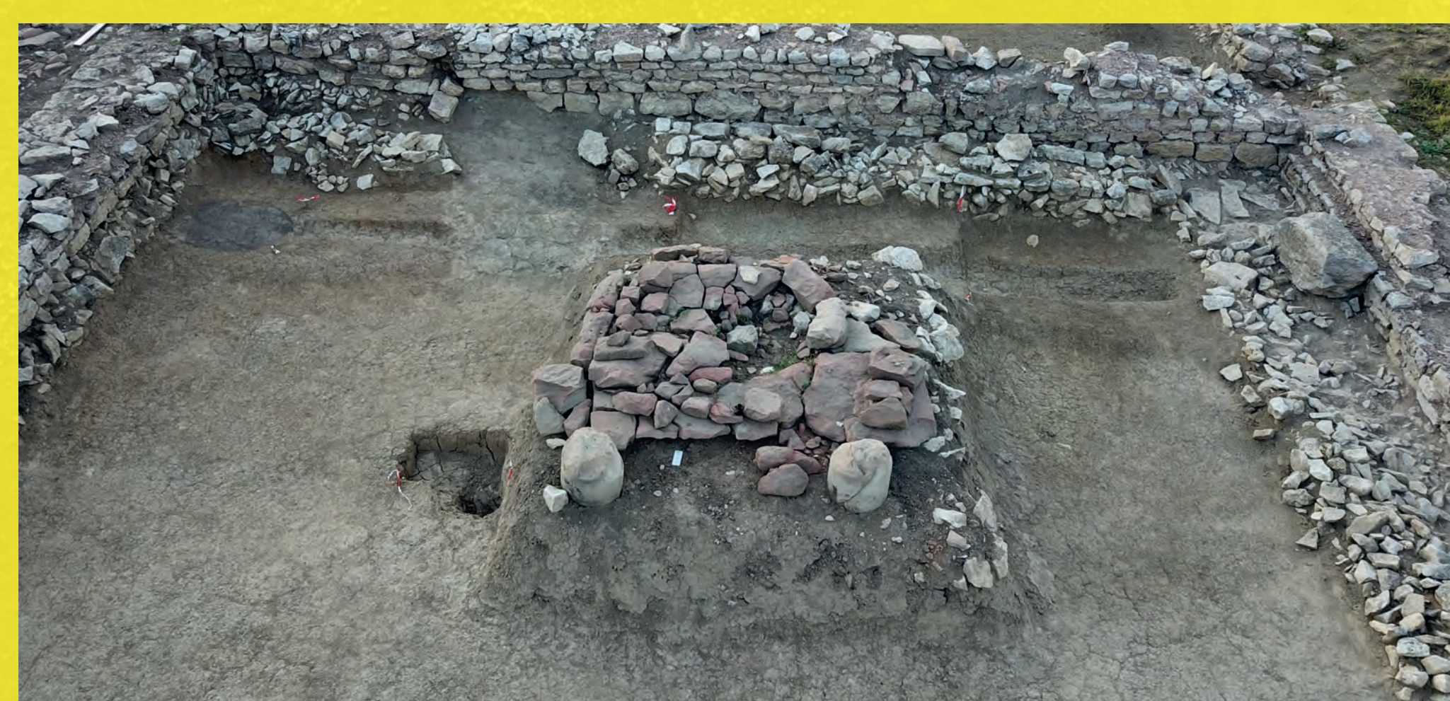
Figure 7 : Structure de métallurgie (A. Nüsslein)

Dans la pièce centrale est installée une structure dédiée à la métallurgie (Fig. 7). De forme rectangulaire (2,30 x 2,15 m), celle-ci est construite en blocs de grès rose remployés, composés à l'ouest d'une grande dalle fragmentée posée à plat, flanquée à l'est et à l'ouest par des pierres mises de champ. À l'est, deux dalles complètent la structure et devant cette dernière, deux fragments de colonnes en grès tourné, avec la tête taillée en pointe, font office de possibles chenets. Tout autour, le sol qui a été fortement piétiné est rubéfié sur 0,80 m autour de la structure. Des scories et des gouttelettes de plomb et de bronze ont été retrouvées sur les dalles et à proximité du foyer et de nombreux objets métalliques (appliques, anneaux, rivets, tôles, etc.) étaient destinés à la refonte. Cette aire de travail a certainement servi à la fabrication des monnaies de substitution imitant les frappes de la fin du III e s. ap. trouvées tout autour. Du verre fondu et des scories supposent un travail lié à ce matériau. Une structure similaire a été découverte à Bliesbruck en lien avec un atelier de bronziers (Antonelli et Petit 2013). Par ailleurs, un ou deux trésors monétaires ont été mis au jour : avec une concentration de 31 monnaies, non agglomérées, découverte sur 0,25 m 2 dans la pièce sud le long du mur nord et de l'autre côté de ce dernier, 11 monnaies. Toutes sont caractéristiques de la circulation monétaire de la fin des années 340.