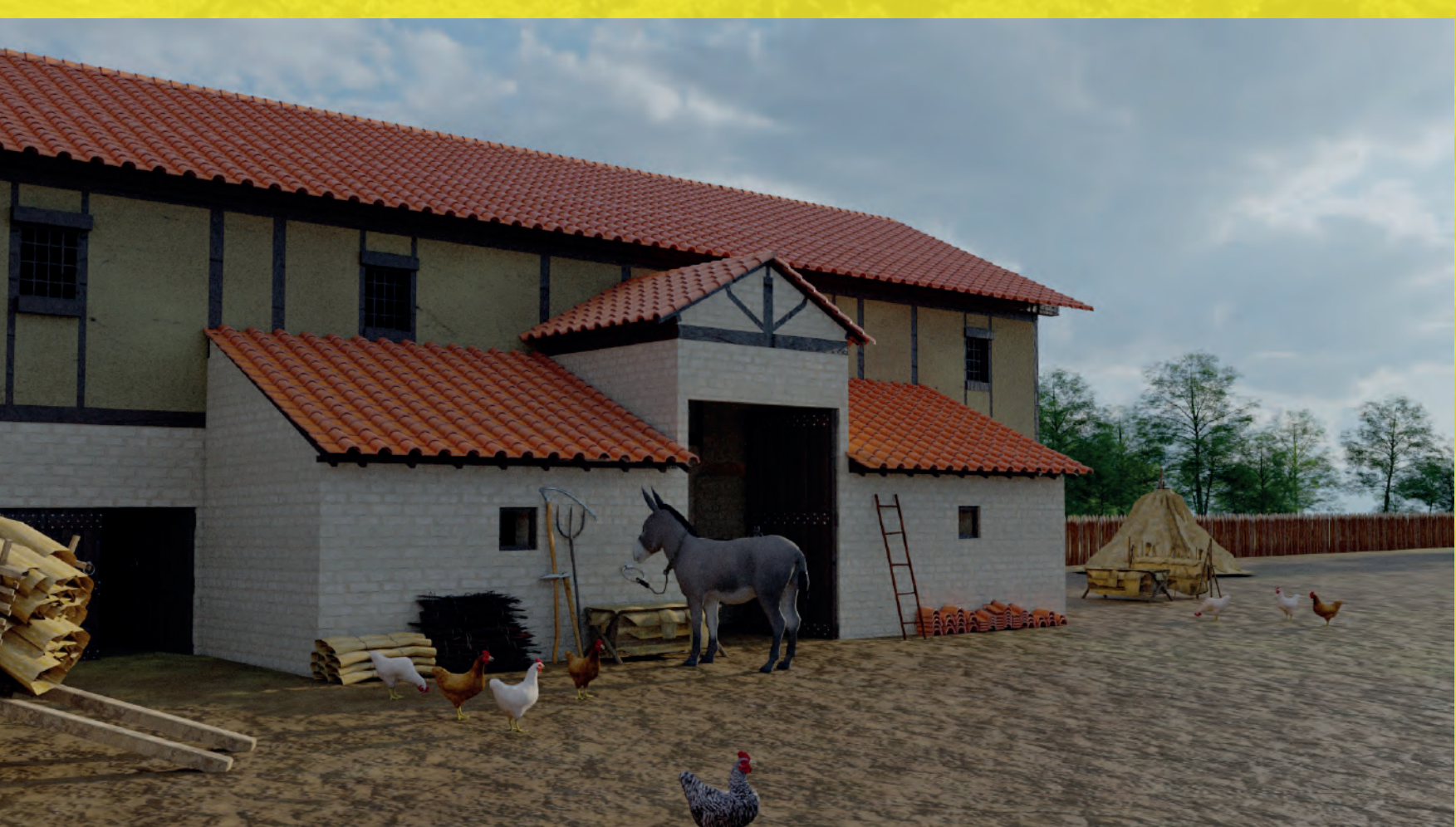
Figure 5 : Proposition de restitution du bâtiment en réalité augmentée (CCAB, Chivron)

découverts dans les niveaux de démolition, possèdent des chanfreins et devaient appartenir à des encadrements de fenêtres ou de portes. L'épaisseur des murs, entre 0,70 m et 0,90 m, invite à considérer un étage. L'entrée dans la pièce principale s'effectue par le porche et un seuil a été dégagé dans la pièce sud. La circulation interne est assurée par une ouverture entre la pièce principale et la pièce nord qui est comblée au cours de l'occupation du bâtiment, et tous les sols sont en terre battue. Deux aménagements ont été mis au jour dans les pavillons de façade : un mur en L dans celle au sud, et dans celle au nord, une construction en fer à cheval (1,78 x 2,05 m) – peut-être antérieure à l'édification de la pièce – dont il reste un hérissan dans la partie arrondie et sur les côtés de grandes dalles calcaires posées à plat (entre 0,60 et 0,80 m). Leur fonction demeure cependant indéterminée.