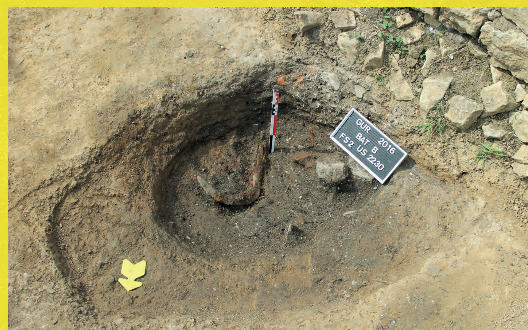
Figure 8 : Fosse rituelle ? (A. Nüsslein)

le radier du mur de façade, de forme ovale (0,90 x 0,80 m) et profonde de 0,35 m. Le fond de la fosse accueille un dépôt dont la composition est atypique avec : une monnaie du 3 e quart du III e s., une faucille, une fibule, une applique en alliage cuivreux et une fusaiole en os décorée. L'installation de cette fosse intervient certainement au moment où le bâtiment est réorganisé et il est possible de se demander s'il s'agit d'un dépôt de (re)fondation.