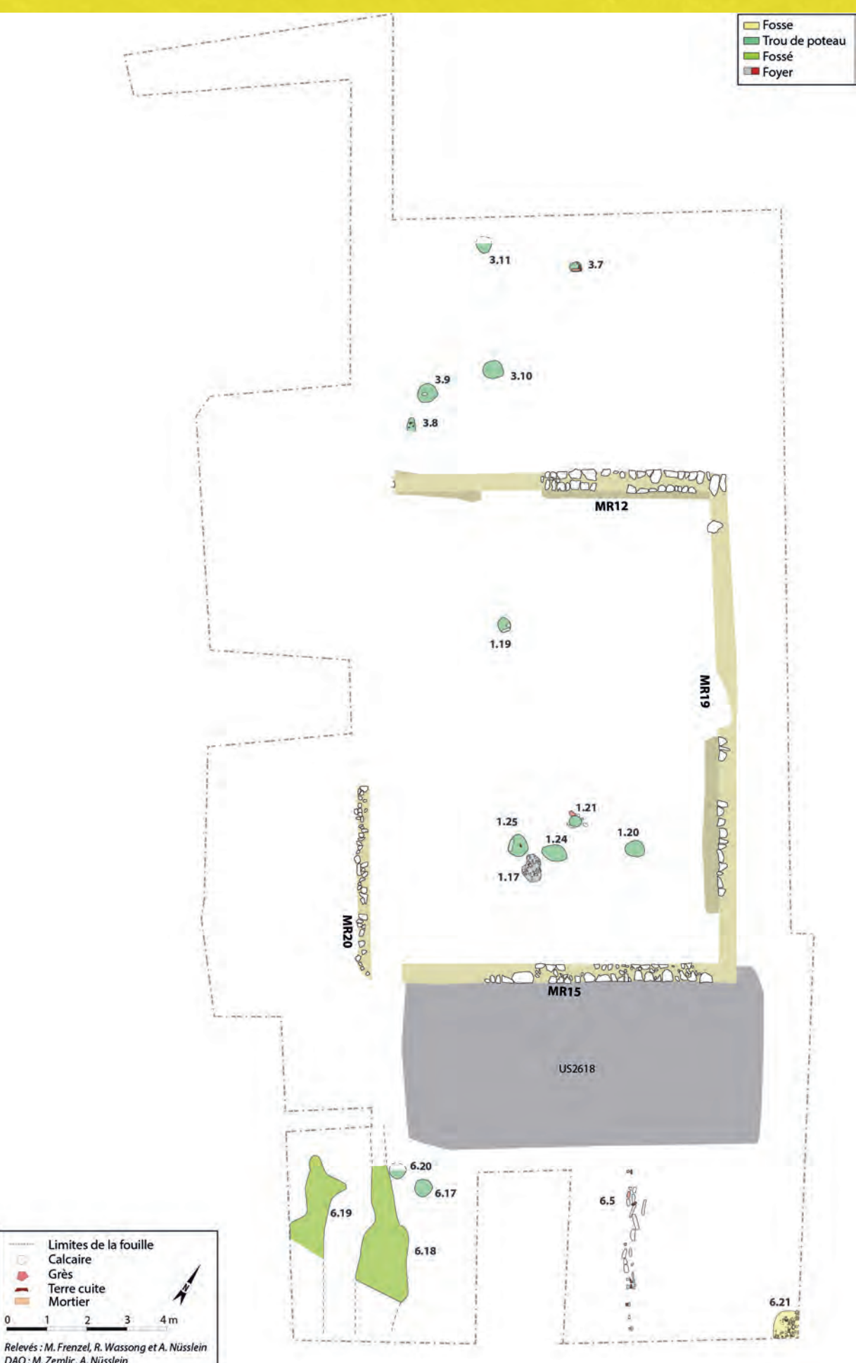
Figure 3 : Premier bâtiment maçonné de la seconde moitié du I er s. ap. J.-C. (A. Nüsslein)

À l'extérieur de la pièce sud, un niveau de circulation empierré peut être interprété comme un potentiel chemin et au nord et dans l'espace central, les fouilles réalisées en 2022 ont dégagé dans la cour des sols empierrés qui appartiennent peut-être à cette phase. Très peu d'indices renseignent sur les activités qui étaient pratiquées dans cette grange et pour cause, les réoccupations tardives ont bouleversé certains niveaux et les fouilles du XIX e s. ont percés ceux en place. La longue durée d'occupation jusqu'au 3 e quart du III e s. se perçoit dans les sols bien conservés qui sont rechargés à plusieurs reprises sans que ces interventions puissent être datées.