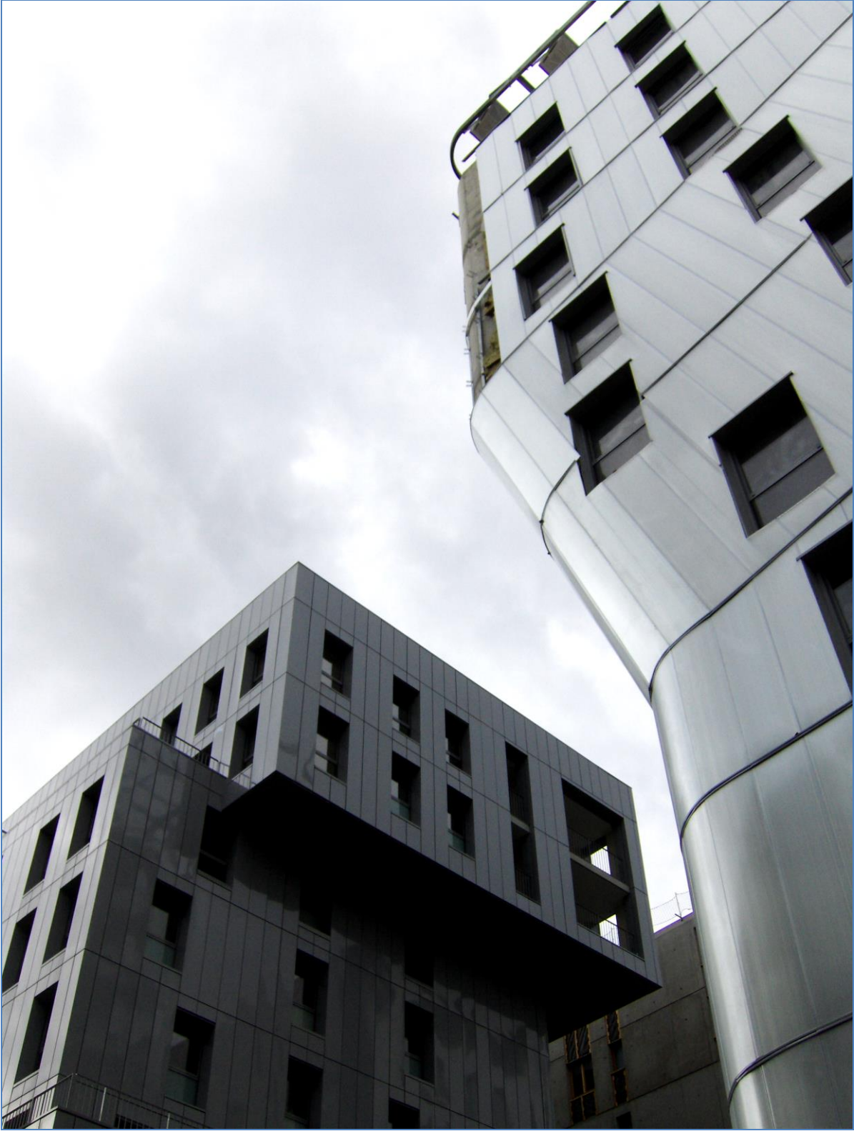
Ilôt A, Lyon confluence, Massimiliano Fuksas et Doriana Fuksas.