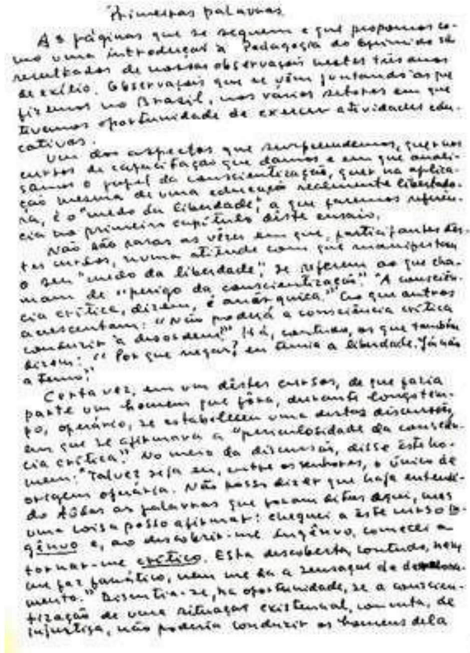
FIGURE 2 : EXTRAIT DU MANUSCRIT ORIGINAL DE PEDAGOGIA DO OPRIMIDO : PREMIER CHAPITRE : PRIMEIRAS PALAVRAS