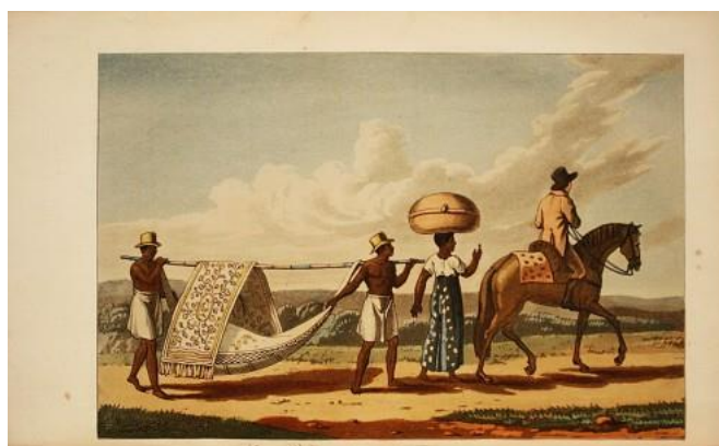
FIGURE 3 : GRAVURE EXTRAITE DE L'OUVRAGE DE HENRI KOSTER

L'esprit du temps qui traversait les contextes historico-culturels, géopolitiques, économiques du Brésil du XIX ème siècle est très bien rendu par des représentations comme en témoigne celle de Henri Koster 31 qui met en évidence les places et les rôles respectifs du maître et des esclaves.