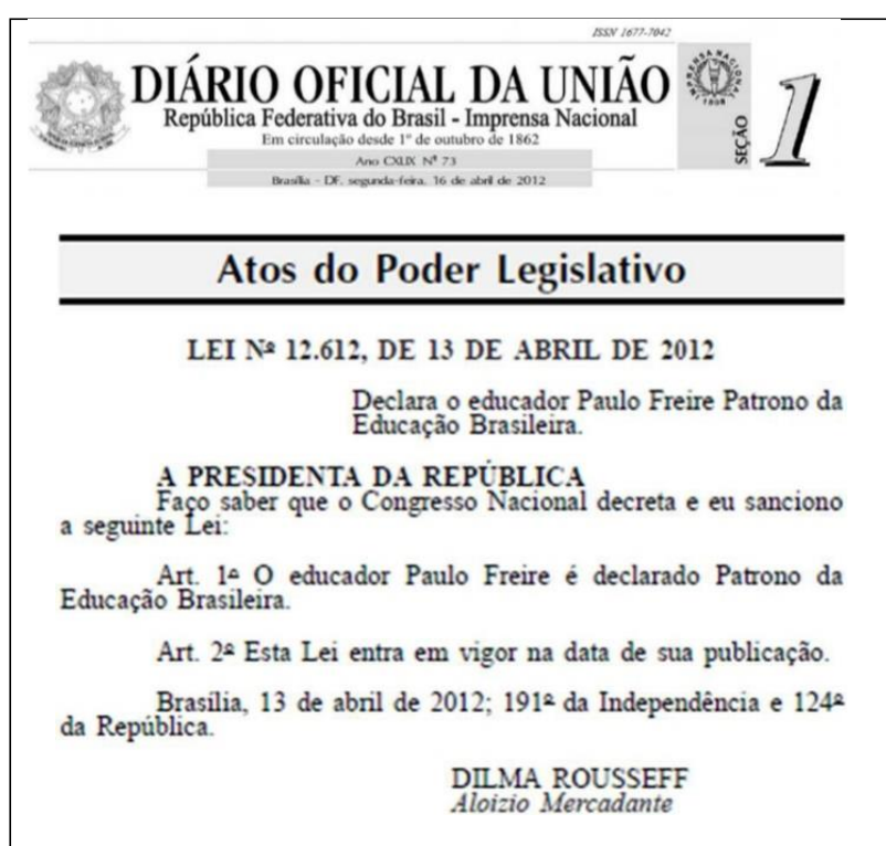
FIGURE 5 : EXTRAIT DU JOURNAL OFFICIEL DE L'UNION BRÉSILIENNE 35

Sous le mandat de la Présidente Dilma Rousseff, première et unique femme, depuis 1889, à avoir assumé la présidence de la République brésilienne sur la période allant 1 er janvier 2011 au 31 août 2016, fut publiée au Journal Officiel de l'Union du 13 avril 2012, la loi n°12.612 consacrant Paulo Freire comme Patrono , Patron de l'Éducation brésilienne, symbole de la défense de l'Éducation.