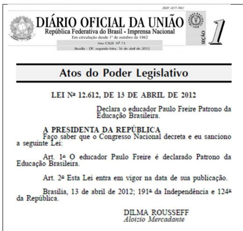
FIGURE 5 : EXTRAIT DU JOURNAL OFFICIEL DE L'UNION BRÉSILIENNE 35

Sous le mandat de la Présidente Dilma Rousseff, première et unique femme, depuis 1889, à avoir assumé la présidence de la République brésilienne sur la période allant 1 er janvier 2011 au 31 août 2016, fut publiée au Journal Officiel de l'Union du 13 avril 2012, la loi n°12.612 consacrant Paulo Freire comme Patrono , Patron de l'Éducation brésilienne, symbole de la défense de l'Éducation.