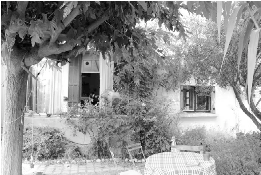
Figure 3 – Un extérieur d'un sociétaire d'Hôtel du Nord, à Mourepiane (16ème).

Ce contexte général posé permet d'analyser plus précisément cette ordinarité touristique dont le champ sémantique renvoie au « banal », au « quotidien » ou au « courant » ( Larousse , en ligne) et qui permettent d'identifier tout d'abord deux dimensions d'« ordinaire ». La première est temporelle. L'ordinaire est le temps du quotidien et de la quotidienneté, c'est-à-dire du rapport au temps objectivé (le quotidien comme le chaque jour de tous et de chacun) mais également celui rapporté aux subjectivités des pratiques et des rapports individuels de chacun (la quotidienneté). La seconde est de l'ordre de la valeur, de cette qualification selon laquelle ce qui n'est pas rare est de moindre prix ; soit la banalité, comme étalon de l'ordinaire, a priori . L'ordinaire, c'est ainsi ce qui est courant, coutumier, voire trivial. Ces deux dimensions d'analyse permettent dans un premier temps de rendre compte des terrains ici mobilisés.