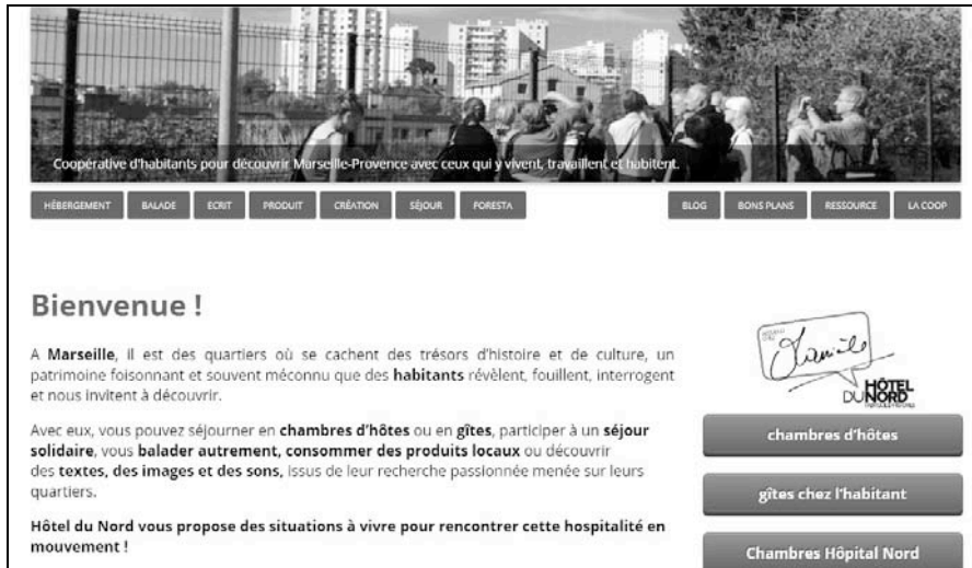
Figure 1 – Captation de l’écran d’accueil du site Internet d’Hôtel du Nord.