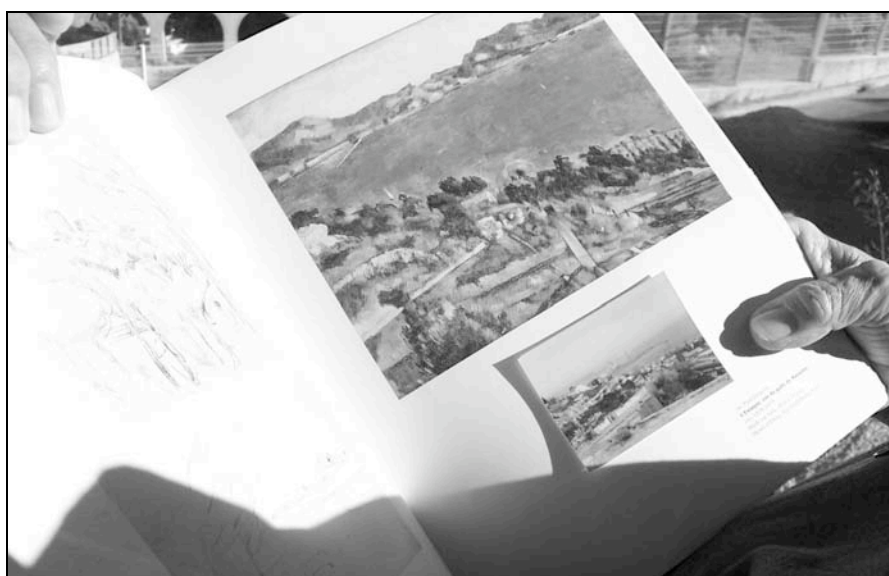
Figures 5a et 5b. – Balade avec un habitant-guide à Hôtel du Nord, ici à l’Estaque (16ème).