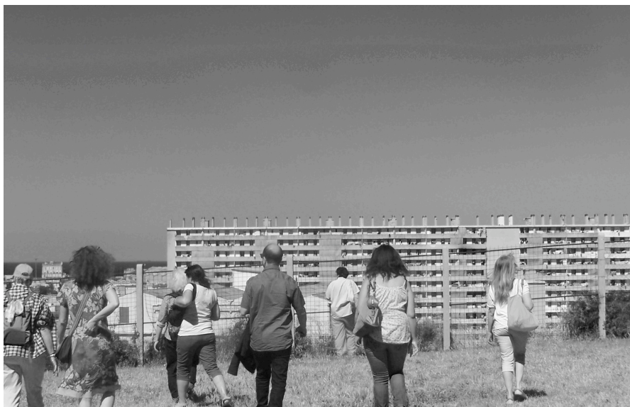
Figure 2 – Un groupe en balade avec Hôtel du Nord à Le Canet (14ème).

Animés d’un projet d’émancipation sociale, les sociétaires d’Hôtel du Nord habitent pour l’essentiel des maisons ouvrières réhabilitées et des bastides. Ils