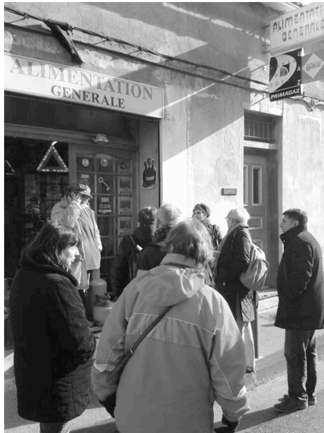
Figure 4 – Balade avec un habitant-guide à Hôtel du Nord, Les Borels (15ème).

parce que du côté de la demande, il faut noter que la majorité des participants aux balades est en provenance de Marseille ou de la métropole. Bien souvent, les visiteurs du nord de la ville sont des habitants de sa partie sud. Ces touristes chez eux, ou presque, découvrent donc, en voisins, si ce n'est un environnement de quotidien, du moins un environnement proche du leur. Faire un pas de côté, se rendre au bout de la ligne de métro est ici suffisant. « Il y a des choses à découvrir tout près, c'est pas la peine d'aller au bout du monde » dit cette Marseillaise participante à une balade.