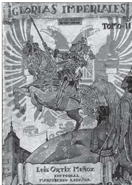
Fig. 3. — Portada de la obra de L. ORTIZ Muñoz, Glorias imperiales [libro escolar de lecturas históricas]

Otro vector privilegiado para adoctrinar a las masas fue la difusión de los símbolos nacionales de la «nueva España» franquista 41 . La bandera rojigualda sustituyó a la republicana tricolor y, por decreto del 2 de febrero de 1938, se le añadió en el centro un escudo de evidente lectura imperial: además de las flechas de los Reyes Católicos, incluía el águila de San Juan, heredado de la reina Isabel. Las referencias a los Reyes Católicos —padrinos del Descubrimiento— no sólo aparecían en la bandera sino, a través de las letras capitales Y/F y el símbolo NO8DO (NO-madeja-DO) 42 , en todos los lugares destacables del espacio público: pendones, escudos, adornos de edificios oficiales. Asimismo, se divulgó para la Marcha Granadera (o Marcha Real ) una letra propiamente imperial, reedición de la compuesta en 1928 por José María Pemán. Véanse las dos primeras estrofas: