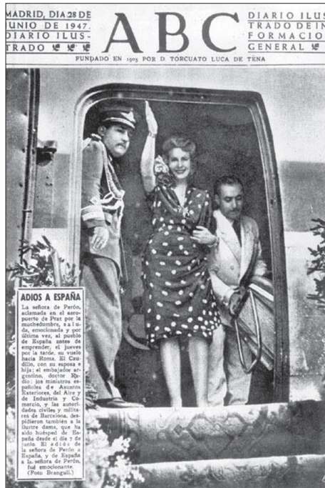
Fig. 4. — Portada del diario ABC dedicada al viaje de Eva Duarte de Perón a España

En ese contexto, la idea de la Hispanidad sufrió un proceso de reformulación que consistió en sustituir el anterior discurso ofensivo, basado en una retórica agresiva e imperialista, por un mensaje mucho más moderado y centrado en planteamientos esencialmente culturales 60 . Las pretensiones de sujeción diplomática del mundo hispanoamericano, que dominaron hasta entonces, dieron el paso a una voluntad más razonable de liderazgo de carácter cultural. La opción católica representada por la Hispanidad se perfilaba, en palabras de Lorenzo Delgado Gómez-Escalonilla, como el «pararrayos» de la Dictadura en el panorama internacional para que la comunidad de las naciones suspendiera su condena 61 . La contraofensiva lanzada por los grupos católicos españoles abanderó una Hispanidad cuyo objetivo no era tanto la propaganda política ni la voluntad quimérica de restaurar un imperio hispánico, sino la defensa del mundo hispanófono contra el riesgo de decristianización.