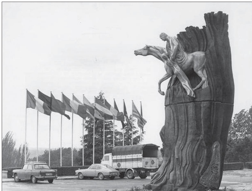
Fig. 6. — Agustín de la Herrán, Monumento a la Hispanidad, inaugurado en 1971, Madrid [ Memoria gráfica de la emigración española , a través de la revista Carta de España ] (© Ministerio de Trabajo e Inmigración)

El carácter eufemístico de la evocación de la conquista traducía el nuevo rumbo que el régimen había otorgado a la Hispanidad, convertida ya en instrumento de concordia y fraternidad.