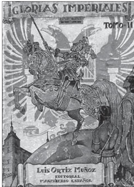
Fig. 3. — Portada de la obra de L. ORTIZ Muñoz, Glorias imperiales [libro escolar de lecturas históricas]

Otro vector privilegiado para adoctrinar a las masas fue la difusión de los símbolos nacionales de la «nueva España» franquista 41 . La bandera rojigualda sustituyó a la republicana tricolor y, por decreto del 2 de febrero de 1938, se le añadió en el centro un escudo de evidente lectura imperial: además de las flechas de los Reyes Católicos, incluía el águila de San Juan, heredado de la reina Isabel. Las referencias a los Reyes Católicos —padrinos del Descubrimiento— no sólo aparecían en la bandera sino, a través de las letras capitales Y/F y el símbolo NO8DO (NO-madeja-DO) 42 , en todos los lugares destacables del espacio público: pendones, escudos, adornos de edificios oficiales. Asimismo, se divulgó para la Marcha Granadera (o Marcha Real ) una letra propiamente imperial, reedición de la compuesta en 1928 por José María Pemán. Véanse las dos primeras estrofas: