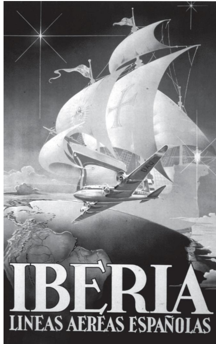
Fig. 5. — Cartel comercial de Iberia [1950] (© Grupo Iberia)

El proyecto de liderazgo cultural y espiritual ambicionado por España en la década de 1940 no dio todos los resultados esperados. La creación de agencias del Instituto de Cultura Hispánica en todas las repúblicas latinoamericanas, que permanecieron inoperantes, ilustraba las limitaciones inherentes al peso internacional de España, el cual padecía del aislamiento de la posguerra y de unos recursos limitados. Si bien la mayoría de las repúblicas iberoamericanas fueron reconociendo el Gobierno franquista a partir de principios de los años 1950, algunas —como México, Cuba o Uruguay— mantuvieron una postura intransigente con él, acogiendo en su territorio a no pocos opositores antifranquistas. Estas realidades encaminaron el régimen a seguir nuevos rumbos.