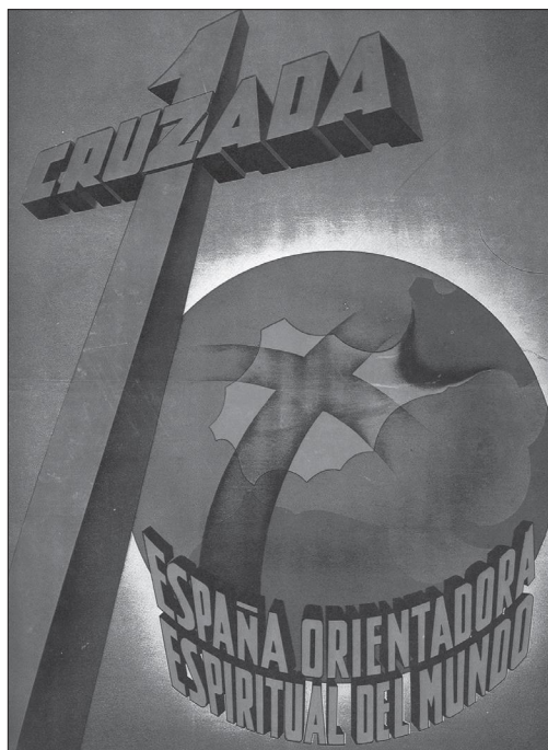
Fig. 2. — Cartel «España orientadora espiritual del mundo» (Colección particular).

La insurrección recibió el apoyo de la derecha clerical y reaccionaria que, a través del movimiento asociacionista católico (Acción Católica, ACdP, Opus Dei), había anatematizado la política laicizadora y las leyes anticlericales de la República. Acorde con el espíritu de «cruzada» de los sublevados, el cardenal Gomá y los obispos españoles defendieron en una carta colectiva de 1937 el alzamiento del bando nacional. La apelación a reanudar el «verdadero» espíritu de la Hispanidad no sólo mitigaba la frustración imperial, sino que vertebraba la ansiada campaña de recristianización lanzada en la zona franquista. La reorganización de la Acción Católica española en 1939 reflejaba bien el espíritu triunfalista y de cristiandad militante en el que se movía entonces la Iglesia católica 21 . La ideología reaccionaria vehiculada por la Hispanidad pasó así a ser un arma política arrojada contra la República laica, secularizadora y liberal, contra la masonería, contra la amenaza marxista y contra la heterodoxia extranjerizante. Presentaba el alzamiento militar y la causa rebelde como la defensa de un presunto verdadero fondo nacional, amenazado por la República. Convertida la Hispanidad en instrumento de combate, la apelación a Santiago, patrón de España y figura prominente en el panteón hispánico, significaba ya la necesidad de luchar contra los nuevos herejes: los comunistas, masones, laicos, liberales, republicanos... tachados todos de «antiespañoles».