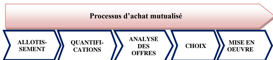
Figure 2 : Modélisation du processus de décisions collectives d'achats de médicaments et DM.

Dans le cas des achats mutualisés de produits de santé, le processus d'allotissement a pour objectif la constitution du livret thérapeutique commun en intégrant les besoins individuels des établissements et les objectifs communs de standardisation au niveau du groupement.