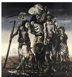
“Retirantes” (PORTINARI, 1944)