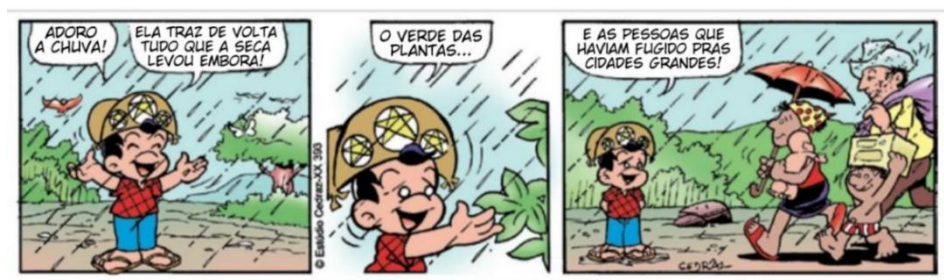
Figura 3: Tira da Turma do Xaxado

Pierre leu a tira da Turma do Xaxado 11 (Figura 3) inicialmente em silêncio e depois, em conjunto com os colegas de turma. Dúvidas eventuais foram sanadas oralmente e possíveis interpretações foram coconstruídas em grupo. A tira mostra a alegria do personagem Xaxado, protagonista e filho de um cangaceiro local, com a chegada da chuva no sertão. O personagem se diz feliz por a chuva ter trazido de volta o que a seca levou, como a vegetação, o verde das plantas e as famílias de retirantes. Várias são as pistas verbais que acionam MCIs na tira. Dentre elas encontram-se “seca”; “levou embora”; “verde das plantas”; “pessoas”; “fugido”; “cidades grandes”.