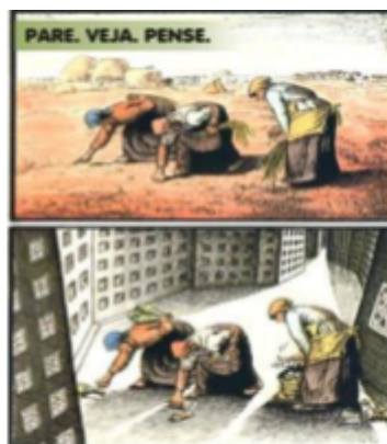
Figura 1: Representações de êxodo rural