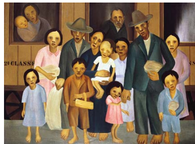
“Segunda classe” (AMARAL, 1923)