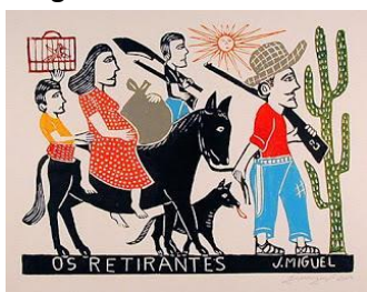
“Os retirantes” (MIGUEL, 2004)