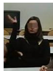
259d. ((laugh))and euh

Le non-verbal peut ainsi rendre le verbal accessoire, voire même écraser le signal linguistique en entraînant la compréhension en contexte d'un énoncé incorrect. C'est le cas dans l'exemple [9] où « Are you ok? » est utilisé à tort pour signifier « Etes-vous d'accord? ». Dans ce contexte de fin d'exercice, les gestes faciaux de l'énonciatrice et son regard adressé à ses interlo-