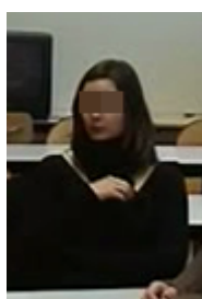
259a. because euh they think euh