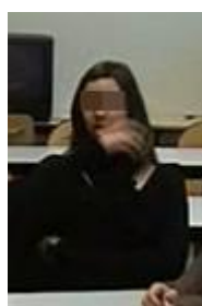
259b. it's very