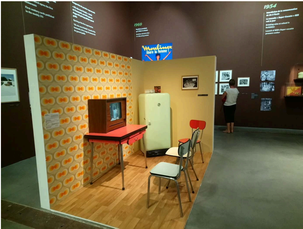
Un espace scénographié de l'exposition présentant une cuisine des années 1970.