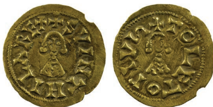
► Fig. 2 : Monnaie de Swinthila frappée à Tolède et mise au jour dans le dépôt de Mauléon (© musée de Borda – Dax, cl. : L. Callegarin).

(MILES 1952, 223d, p. 281 ; PLIEGO VÁZQUEZ 2009, 361a, n° 13, p. 227).