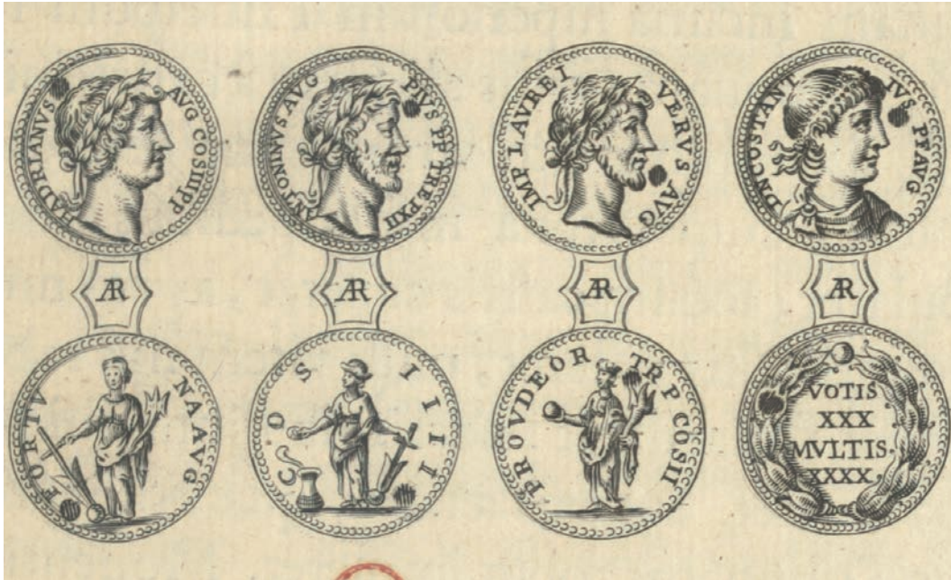
► Fig. 5 : Quelques monnaies d'argent issues de la tombe de Childéric, Jean-Jacques Chifflet, Anastasis Childeric I, Francorum regis , 1655, p. 271.