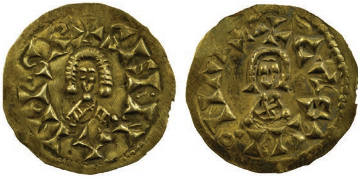
► Fig. 3 : Monnaie de Sisenand frappée à Castulo et mise au jour dans le dépôt de Mauléon.