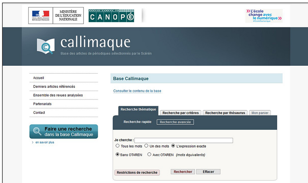
Figure 3. Masque OPAC Callimaque

Dans le cas du Sudoc, le masque à remplir est réduit. Il apparaît tout en haut de la page. Il fait assurément figure de l'OPAC le plus simple à utiliser, mais ce n'est qu'une apparence. La difficulté rencontrée repose sur l'indexation des documents. Les millions de notices compilées imposent, de la part de l'étudiant, une dextérité certaine. Il faut arriver à tricoter les différents critères de recherche possibles, sinon la noyade est assurée.