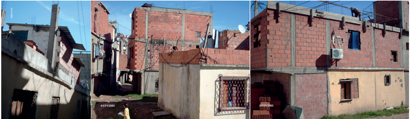
FIGURE 6 La réalisation d'un projet où l'intimité, le vis-vis et l'accessibilité sont compromis | Source: Mebirouk, 2005 | Adaptée par le Département de géographie de l'Université Laval, 2019