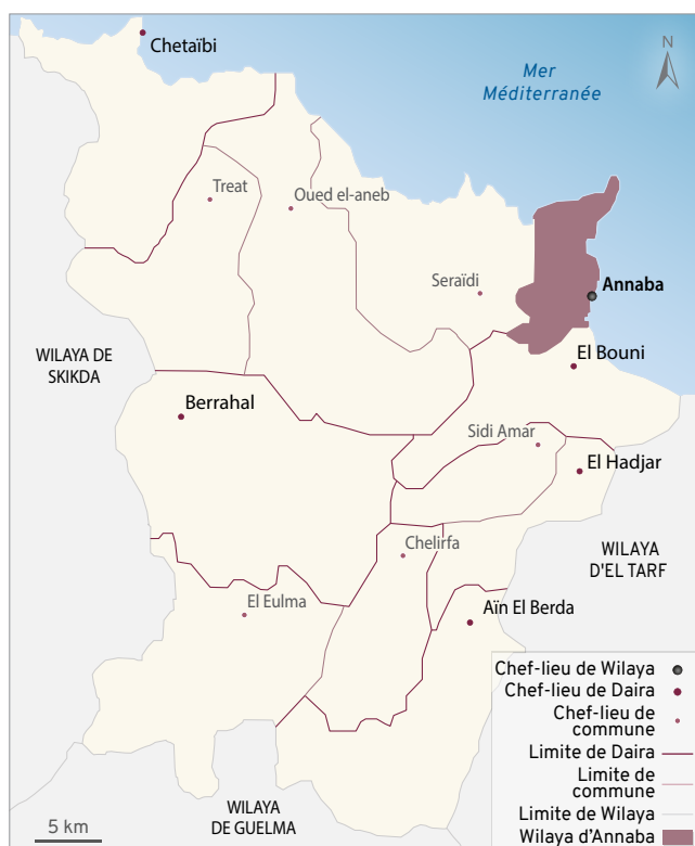
FIGURE 2 Limites de la Wilaya d'Annaba | Source : Mebirouk, 2011 | Adaptée par le Département de géographie de l'Université Laval, 2019

De 1962 à 1966, l'afflux de population vers la ville a été absorbé par les logements laissés par les colons. Ce n'est qu'en 1967 que fut lancé un programme industriel ambitieux reposant sur la construction du complexe sidérurgique d'El-Hadjar (un des principaux pôles industriels algériens) suscitant la création de 500 emplois et générant un accroissement démographique excessivement élevé par la combinaison d'une croissance naturelle forte et d'un solde migratoire important. Durant la période 1966-1969, cet excédent démographique s'est surtout soldé par la