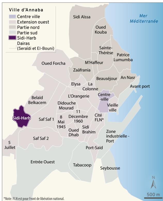
FIGURE 4 Localisation du site de Sidi-Harb | Adaptée par le Département de géographie de l'Université Laval, 2019