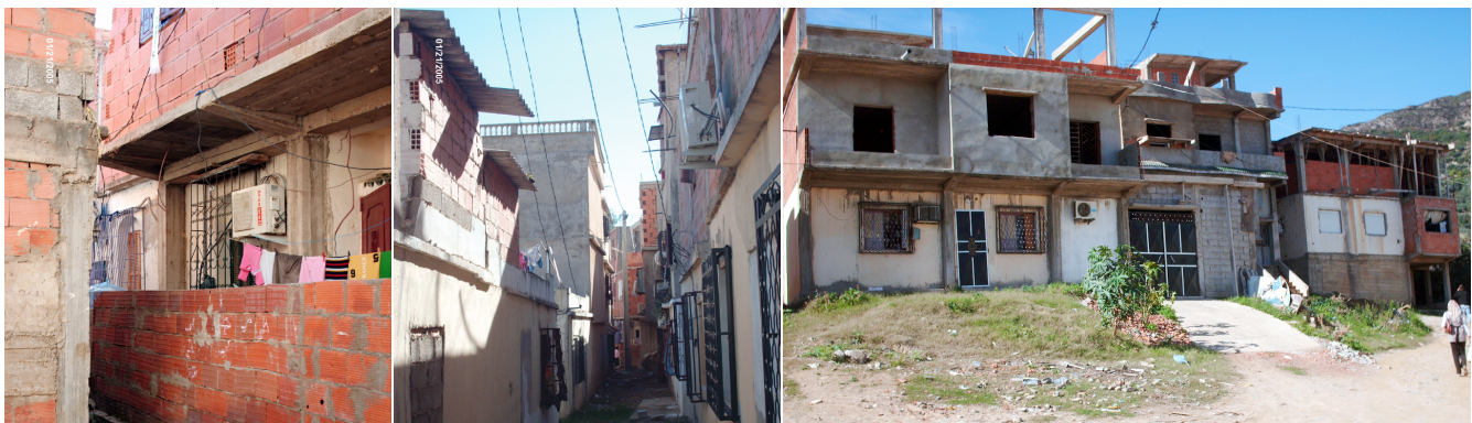
FIGURE 7 Un habitat précaire qui se développe sans référence à la richesse naturelle | Source : Mebirouk, 2005 | Adaptée par Le Département de géographie de l'Université Laval, 2019