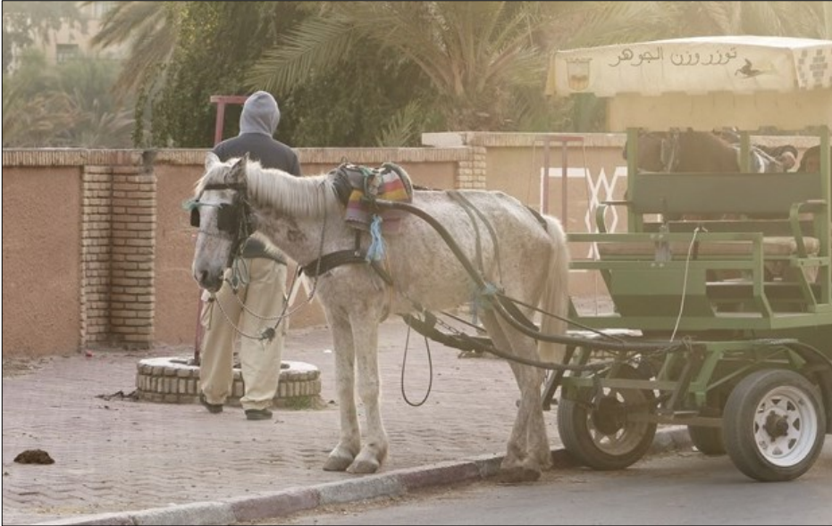
13 février 2020, zone touristique de Tozeur.

L'implication de SPANA et la présence de touristes très sensibles à la notion de bien-être animal contribuent à un mécanisme d'ouverture vers la culture occidentale. Les nouvelles générations de Tozeurois, à condition d'avoir un capital financier le permettant, vont probablement considérer comme important d'exposer un cheval très bien soigné au regard d'autrui. Le cheval devient un indicateur du prestige, et le soin de l'animal un facteur renseignant sur le prestige de l'individu. L'économie du tourisme est restructurée par le soin à l'animal, sous l'influence des touristes occidentaux.