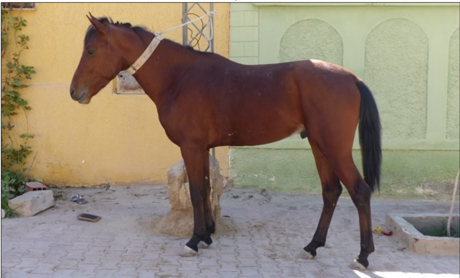
15 février 2020.