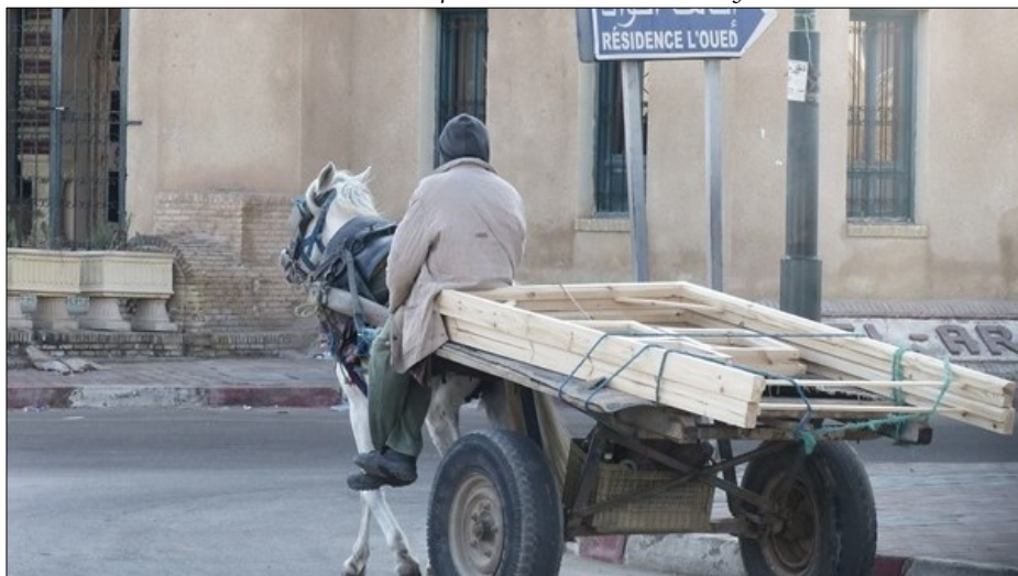
15 février 2020.

Photo 1 : Charrette hippomobile à roues pneumatiques et plateau surélevé, conduite depuis les quartiers de Ras adh-Dhrâ par un homme relativement âgé.