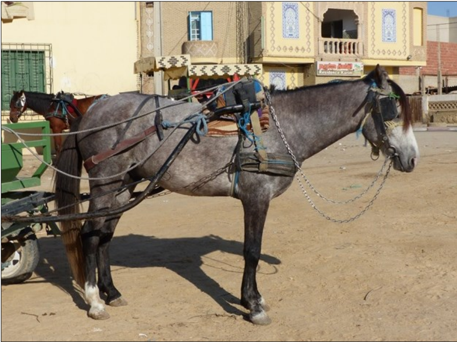
Tozeur, avenue Habib-Bourguiba, halte des caléchiers. 15 février 2020.

Photo 10 : Barbe « pur », mis à l'attelage. Le port d'encolure bas est évoqué comme une caractéristique discréditant ce cheval pour un usage monté.