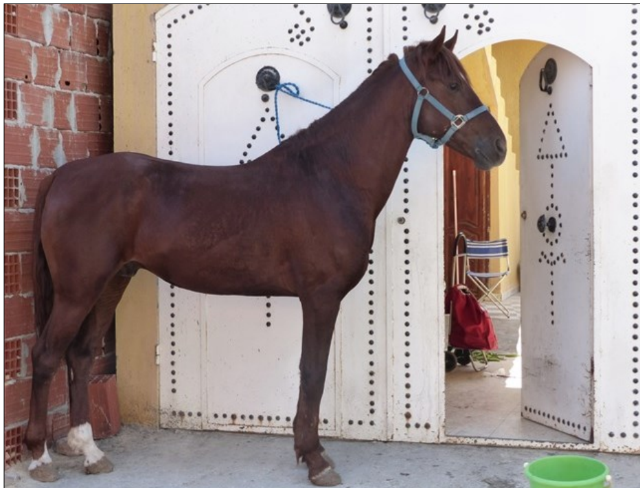
Photo 8 : Arabe-Barbe alezan attaché devant le domicile de son propriétaire, pour le pansage, dans le quartier bédouin (Rkârka) d'Helba, Ras adh-Dhrâ°.

15 février 2020.