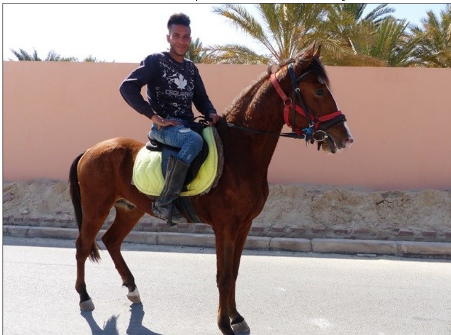
Zone touristique de Tozeur, 15 février 2020.

Sur la photo ci-dessus, le port d'encolure haut, valorisé pour la selle, dénote(ra)it les origines arabes de ce cheval, lui valant la plus prestigieuse fonction de monture d'apparat. Son harnachement apparaît très moderne, dans un état d'entretien impeccable. Le cavalier, fier de prendre la pose sur sa monture, porte des chaps traduisant une appropriation de la pratique de l'équitation et d'un matériel d'origine occidentale.