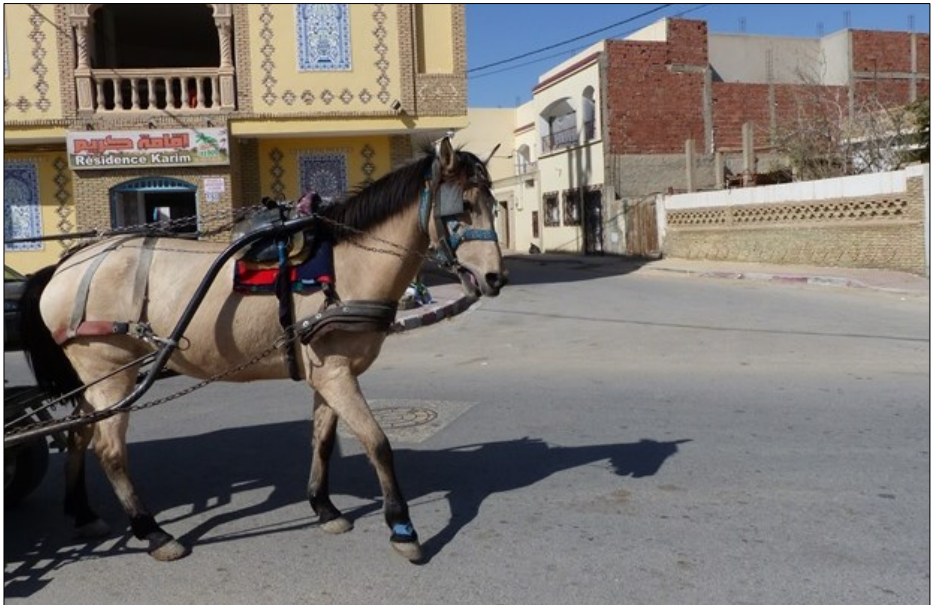
16 février 2020, avenue Habib-Bourguiba.

Photo 2 : Arabe-Barbe de calèche (doté d'une robe isabelle, base baie avec simple dilution par le gène Crème, un gène qui n'existe pas chez l'Arabe de pure race), bien nourri et bien entretenu.