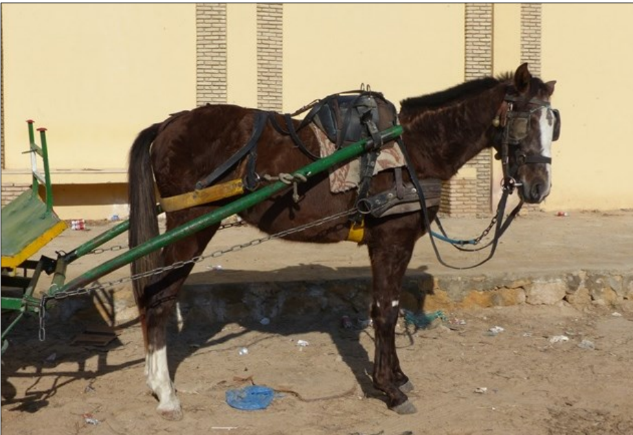
15 février 2020, point d'arrêt des caléchiens, avenue Habib-Bourguiba.