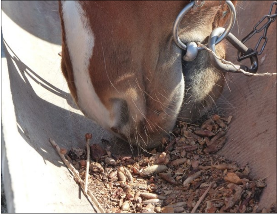
14 février 2020, dans une exploitation agricole à environ 3 km de Tozeur.