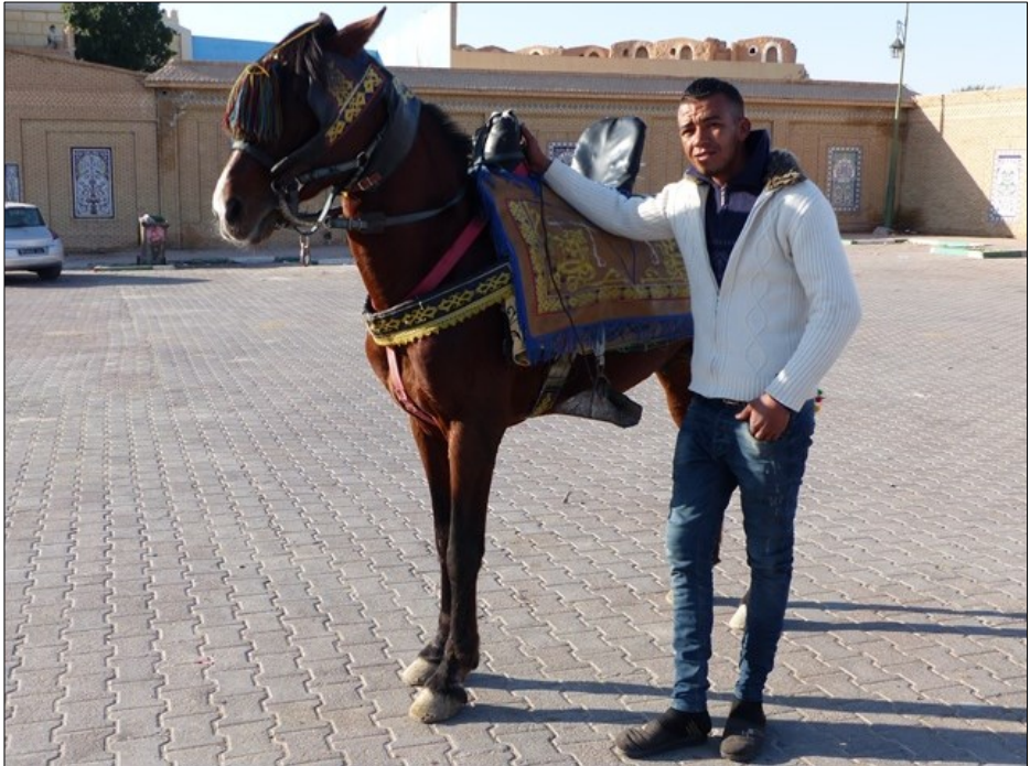
Tozeur, zone touristique, 14 février 2020.

Sans que cela constitue une règle absolue (comme le montre la fig. 8), les chevaux de race Barbe sont prioritairement associés aux tâches de travail, et l'Arabe-Barbe, en particulier s'il présente un haut taux d'origines arabes, est dévolu aux spectacles et à la fantasia. Si le cheval continue à revêtir une fonction de marqueur social, la folklorisation de son usage amoindrit son lien historique avec les pratiques bédouines et efface sa charge symbolique, pour en faire peu à peu un simple instrument au service d'activités économiques.