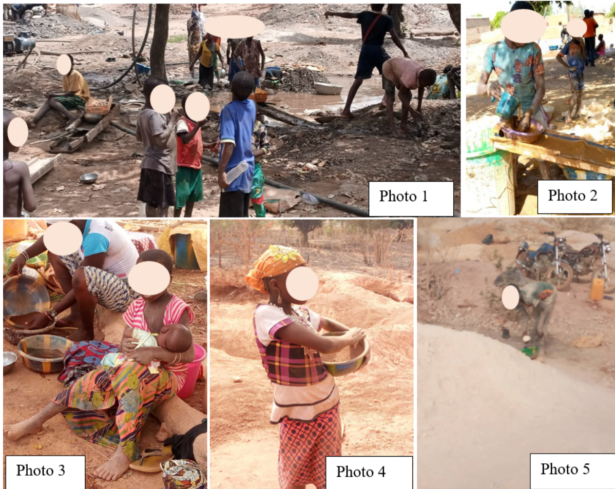
Planche 1 : Illustration des travaux des enfants sur les sites : amusement, lavage, baby-sitter, vannage et restauration