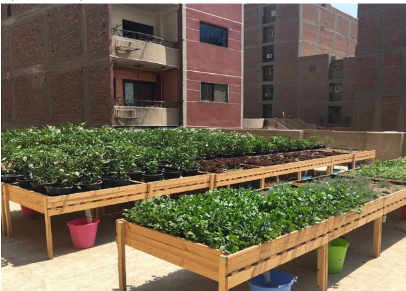
Figure 7. Une agriculture urbaine sur table à Ard El Lewa. © CPH, 10/04/18

Il s'agit donc du même modèle que les installations à Matariya, c'est-à-dire une agriculture urbaine de projet, sur le toit d'une école, dans un quartier informel et avec forte implication des professeur.e.s et des élèves. Al Nabat fournit les plants et un accompagnement technique. Concrètement, alors que les plants de tomate étaient en mauvais état, le membre d'Al Nabat a expliqué aux professeur.e.s qu'elles manquaient de calcium et il leur a recommandé d'en asperger les tomates plus régulièrement. Il vient environ toutes les deux semaines pour faire ce genre de contrôle. Cette fonction