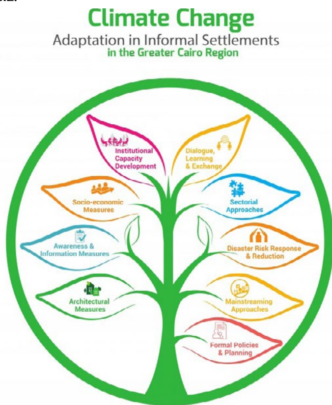
Figure 16. Les composantes de la stratégie d'adaptation de la GIZ au changement climatique dans les quartiers informels.

d'aménagement étatique reposent au contraire sur la dédensification des quartiers informels péri-centraux et sur leur végétalisation, ce à quoi les projets d'agriculture urbaine étudiés s'adaptent. Le végétal est accepté, l'animal est rejeté de ces dispositifs. La valorisation de la dimension esthétique de ces installations correspond à ces impératifs de green washing urbain.