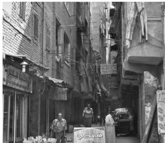
Figure 20: A Narrow (3-4 m) street in Imbaba

GREEN SPACE ██████████ OPEN SPACE ██████████