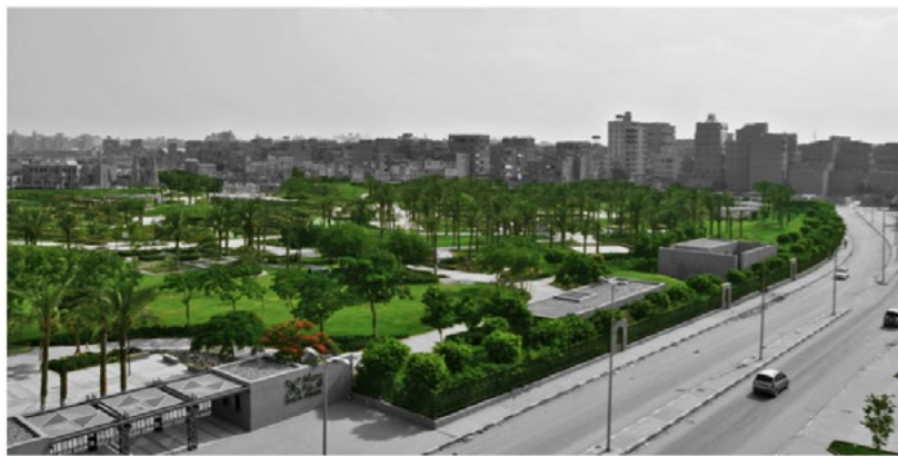
Figure 19: Glass Park in Imbaba: a project executed on a part of the previous airport land

The infographic is a visual representation of the authors analysis for the visited streets. It does not reflect specific percentages.