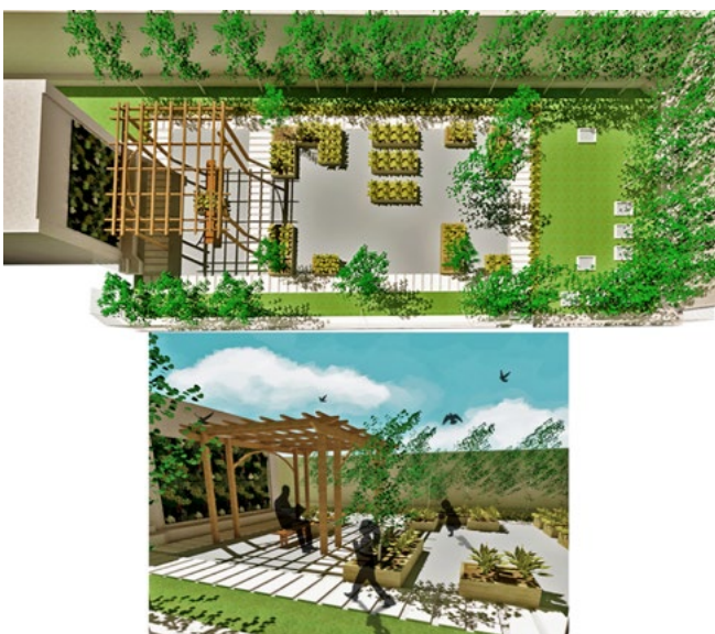
Figure 3. Designs de jardins communautaires pour deux sites du projet du RISE.

Le projet est composé de cinq installations : trois fermes urbaines sur les toits de deux écoles et une association (C.) ; deux jardins communautaires (Figure 3) dans un centre de jeunesse et une bibliothèque. Nous nous concentrerons sur les toits agricoles car ils sont déjà mis en place, contrairement aux jardins, et surtout car la fonction alimentaire n'en est pas exclue par principe. Les jardins communautaires, qui comprendront des