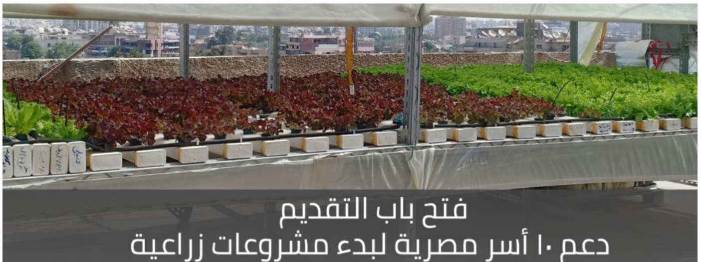
Figure 8. « Soutien à dix familles égyptiennes pour créer des fermes sur les toits », le nouveau projet de toits agricoles de S.

S. est une entreprise créée en 2010 pour mettre en place une forme d'agriculture urbaine dans les quartiers informels. Si cet objectif initial semble avoir été relativement relégué au second plan à partir de 2014-2015 au profit d'une diversification des activités vers des fonctions plus ornementales, environnementales et paysagères (murs végétaux, toits verts), un nouveau projet de toits agricoles est actuellement mis en œuvre. Pour la description de ce projet, je ne peux m'appuyer que sur l'entretien effectué avec deux membres de S. car je n'ai pas pu accéder aux installations, faute de temps et d'autorisation. Cela invite à prendre les données transmises — chiffres, pratiques effectives, réception par les habitant.e.s — avec précaution, d'autant que je n'ai pas non plus eu accès aux documents de présentation du projet.