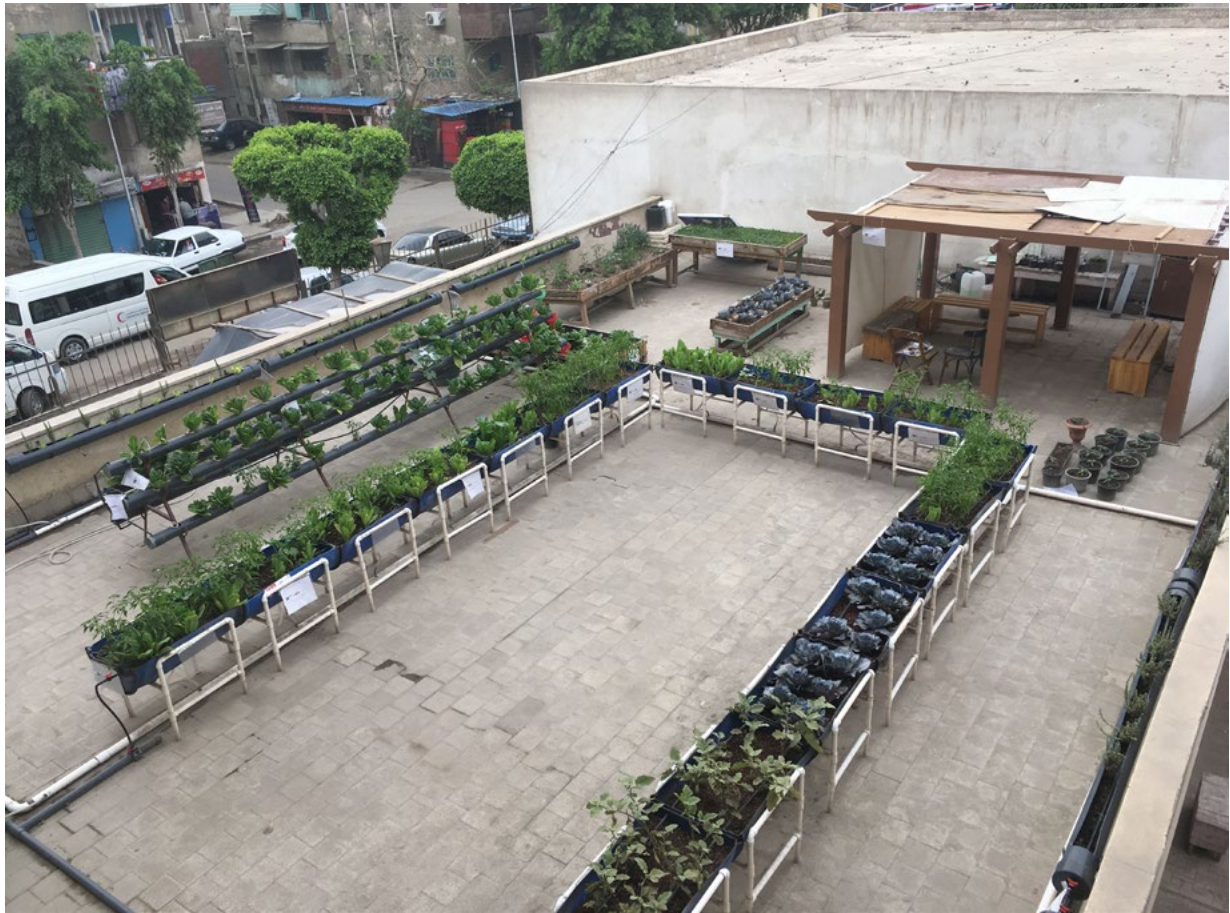
Figure 2. Ferme sur le toit de l'école Al Nour (Matariya). 28/03/18

Le projet est composé de cinq installations : trois fermes urbaines sur les toits de deux écoles et une association (C.) ; deux jardins communautaires (Figure 3) dans un centre de jeunesse et une bibliothèque. Nous nous concentrerons sur les toits agricoles car ils sont déjà mis en place, contrairement aux jardins, et surtout car la fonction alimentaire n'en est pas exclue par principe. Les jardins communautaires, qui comprendront des