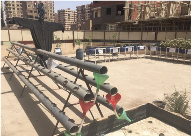
Figure 12. Difficultés techniques et tentatives d'adaptation sur le toit de C.. © CPH, 14/04/18