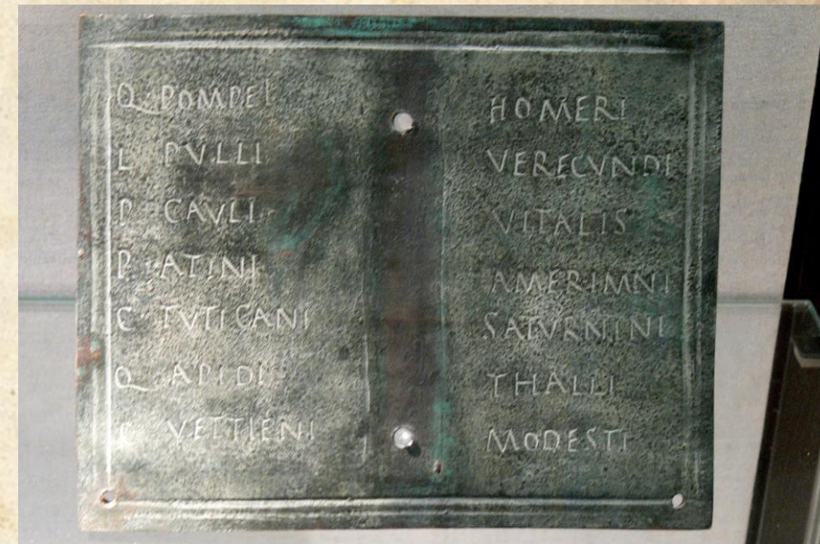
Esempio di lista di testimoni su un diploma

Battuta tra veterani? scherzo del lapicidio? difficoltà a trovare testimoni cittadini romani?