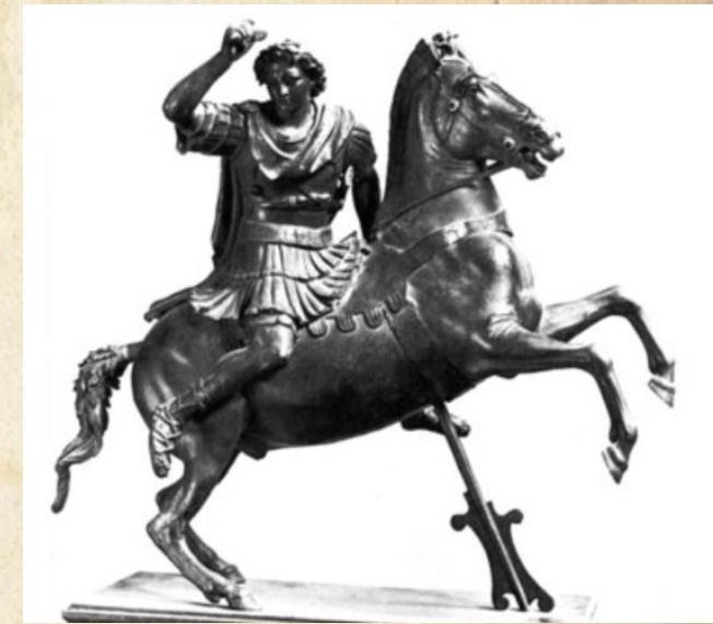
Statuetta di Ercolano