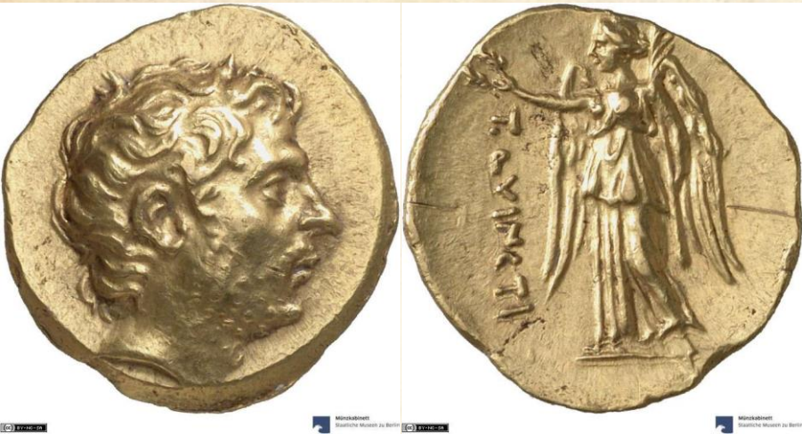
Statere d'oro di Flaminino