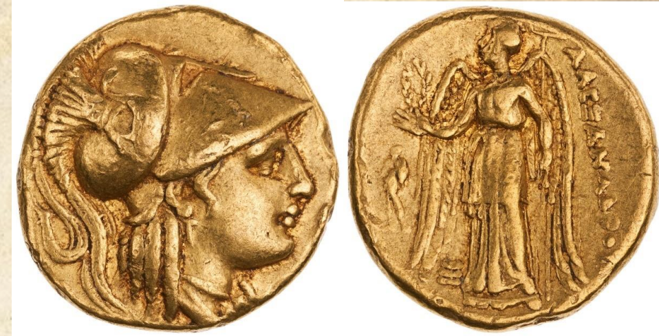
Statere d'oro di Alessandro