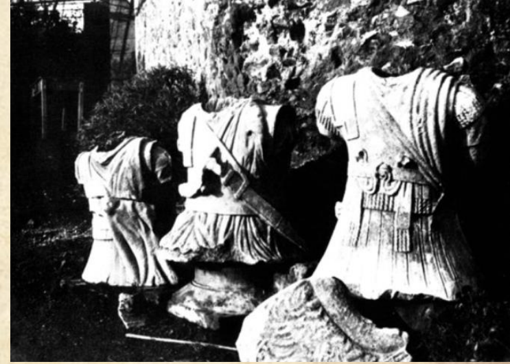
Busti dei cavalieri di Lanuvio al momento dello scavo