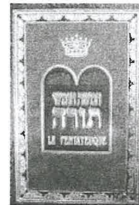
Le Pentateuque suivi des Haftarah et des prières du samedi matin.

La figure centrale du Pentateuque, probablement achevé vers 300 av. n.è., est Moïse qui reprend les fonctions du roi, puisqu'il promulgue la loi et est le médiateur par excellence. Le Pentateuque se termine par la mort de Moïse qui voit le pays promis mais n'y entre pas. Cette « fin ouverte » tient compte de la situation d'un judaïsme de diaspora, et signifie aux juifs qui vivent en dehors de la Palestine, que le fondement de leur identité n'est pas le pays mais la loi divine transmise par Moïse.