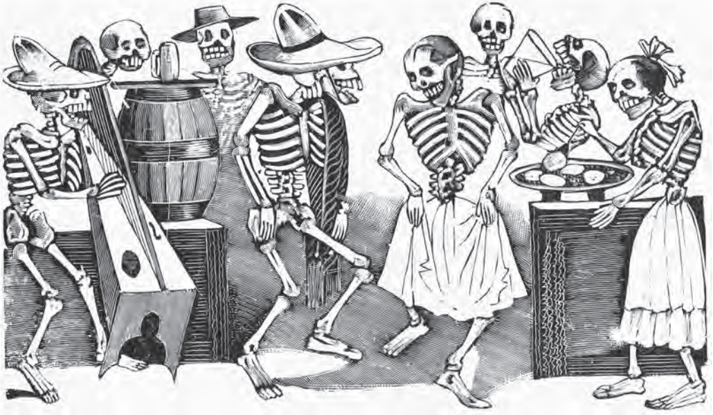
José Guadalupe Posada, Jarabe en ultratumba .

Guadalupe Posada y Antonio Vanegas Arroyo, serán sus forjadores.