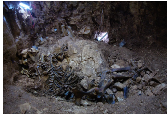
Figure 2 : Vue éloignée de deux des chevaux du Coulet.

Les parois portent la trace de plusieurs épisodes de concrétionnement datées par Uranium/Thorium (Pléistocène moyen, Greenlandien, phase Atlantique et âge du Fer ; sept datations) (Fig. 1). Cinq unités stratigraphiques (US) ont été reconnues et la faune a été datée par radiocarbone (31 datations) (CRÉGUT-BONNOURE et al. 2014, 2018). Les travaux de désobstruction ont détruit en presque totalité l'US1 et l'US2 et ont entamé l'US3.