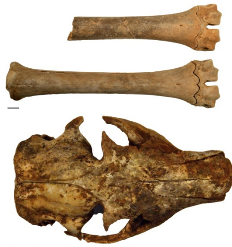
Figure 3 : Colonne de gauche, plan du fond de l'aven des Planes (Topographie S. Clément). Colonne de droite, métatarsiens de renne (haut) et crâne de marmotte (bas) (échelle 1 cm.).