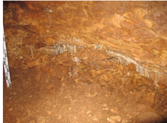
Figure 1 : Vue générale du Coulet des Roches (à gauche). et concrétionnement sur la paroi ouest (à droite).

de long sur 3 à 4 m de large (Fig. 1). Dans l'angle sud-ouest se trouve une diaclase, élargie par les spéléologues, dont le point bas est à -16,50 m. Les sédiments conservés occupent une surface évaluée à 25 m 2 .