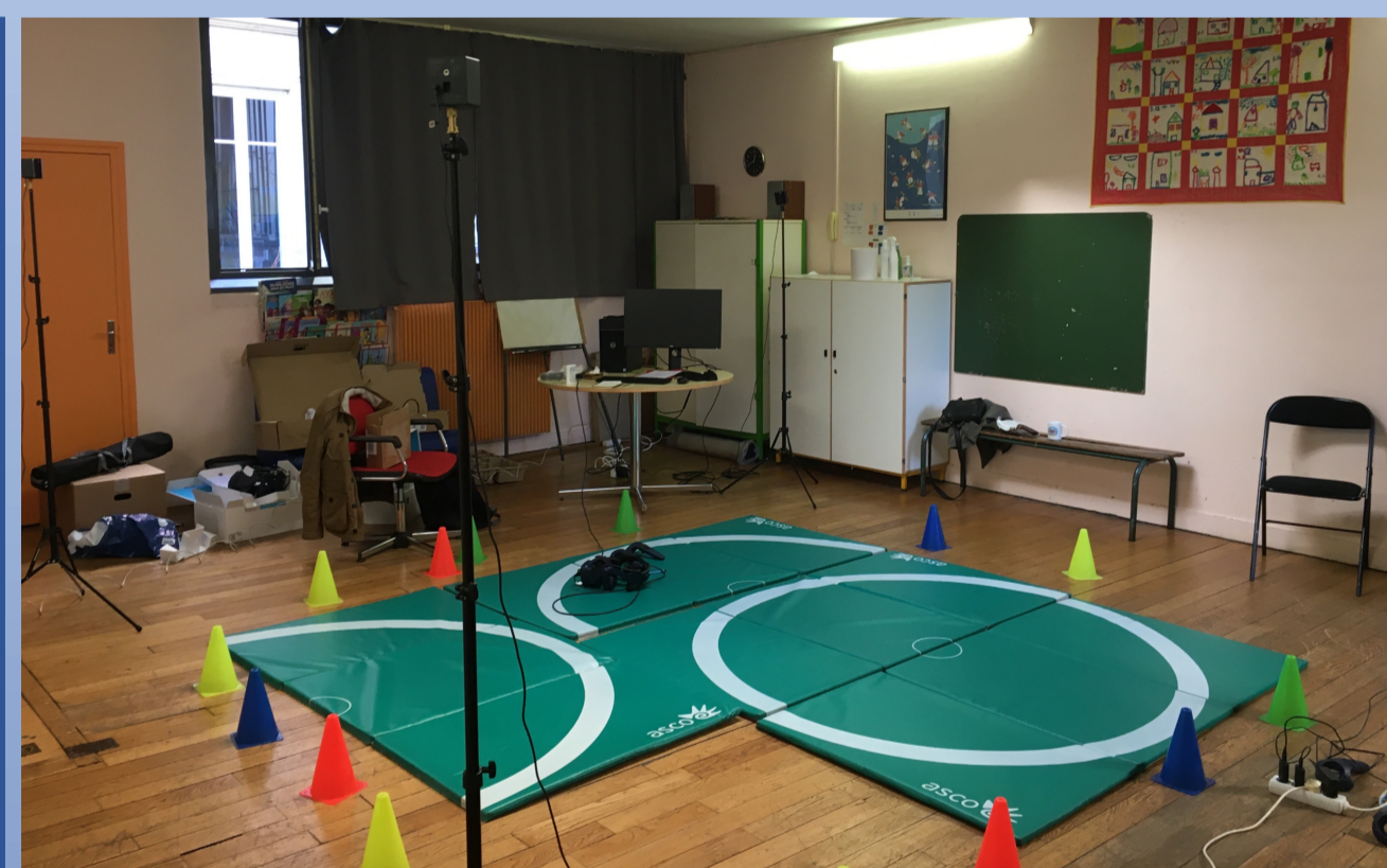
Fig. 2 : Salle de tests au sein de l'hôpital de jour