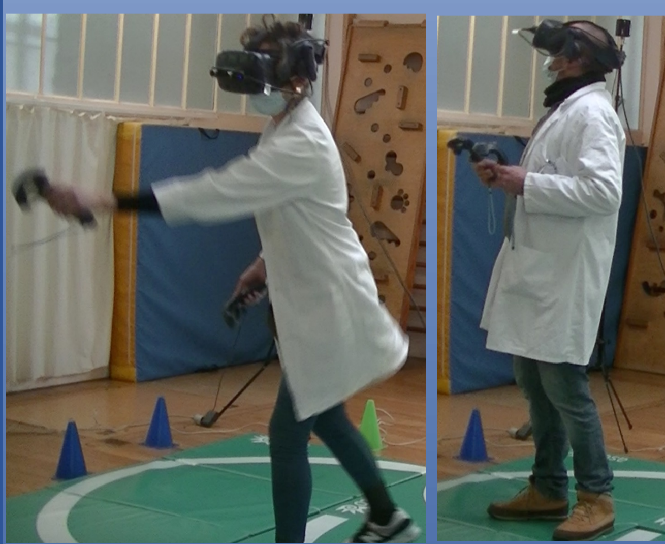
Fig. 3 : Praticiens testant l'application