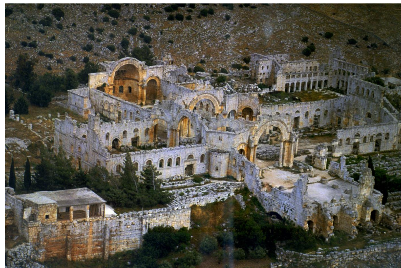
Рис. 4. Общий вид на монастырь Св. Симеона Столпника. Слева внизу – дом Георгия Чаленко.