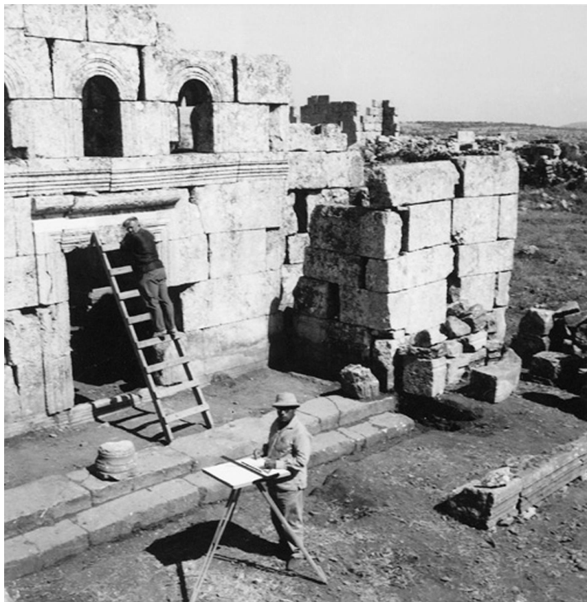
Рис. 2. Георгий Чаленко во время исследований в Кал'ат Сем'ане. По: Tchalenko, 2019.