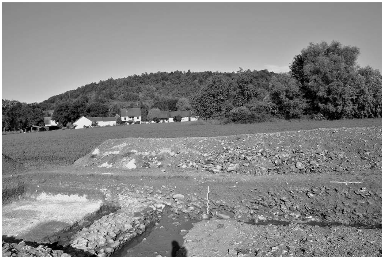
Fig.2 : Vix, La Navette (21) : le rempart en cours de fouille. Le mur est au premier plan, la Seine coule derrière les maisons et au fond, le mont Lassois

32 m) relance le débat sur les modalités de l'extension de l'habitat princier de Vix sur les deux rives du fleuve (prospections 2018, DAI, Friedrich Lüth, Rainer Komp). Au nord de la maison 6, des traces de fossés, des tranchées de fondation et des structures en creux révèlent une zone d'habitat. Celle-ci est bordée au nord par deux larges structures linéaires parallèles à la maison 6 qui pourraient correspondre à un tronçon de fortification perpendiculaire à la Seine (Chaume et al. , 2020). En juin 2021, une fouille archéologique, menée comme un diagnostic, a permis de mettre en évidence le système défensif pressenti par Bruno Chaume dans la plaine alluviale de la Seine, sur la rive droite. En accord avec le Service régional de l'archéologie de Bourgogne Franche-Comté, une tranchée de 27 m de long pour une largeur de 5 m a été ouverte à la pelle mécanique, transversalement à la fortification supposée (Krausz et al. 2021). Au sud-est de la tranchée, une fenêtre de 13 m de côté a été prévue pour caractériser les structures en creux révélées par la prospection géophysique. L'emprise ouverte couvre ainsi au total 350 m 2 , la coupe transversale permettant d'observer le dispositif défensif dans sa globalité, de l'avant à l'arrière de l'ouvrage.