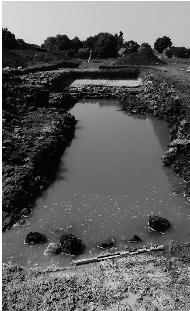
Fig.3 : Vix, La Navette (21) : vue générale de la tranchée de fouille le 18 juin 2021. Au premier plan : les poteaux engagés dans la paroi nord du fossé ; au milieu, le fossé inondé par la remontée de la nappe alluviale ; au fond, le rempart

Entre le parement externe du rempart et le bord sud du fossé se trouve un espace de 3,20 m de large qui pourrait correspondre à une berme de maintenance. Comme son nom l'indique, la berme d'un rempart est une zone permettant d'assurer l'entretien de l'ouvrage tout en empêchant que les éboulis ne tombent dans le fossé. Sur la berme, ils peuvent aisément être nettoyés et évacués et cet espace offre un accès direct au parement pour d'éventuelles réparations. Selon les modèles de remparts, elle peut être inclinée en pente douce vers le fossé ou offrir un plan horizontal. Elle ne sert généralement pas de chemin, mais dans certaines fortifications, il est possible de circuler dans cet espace et on ne peut exclure cette fonction ici étant donné sa largeur importante.