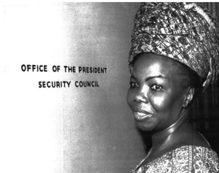
Jeanne Martin Cissé devant son bureau de Présidente du Conseil de Sécurité des Nations Unies en 1972 22