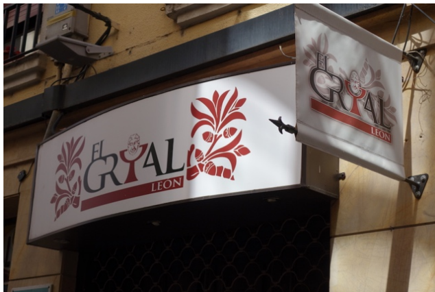
Fig. 8. L'enseigne du bar « El Grial », León, Calle López Castrillón. Cliché Sophie Albert, avril 2018.

« habiter » et, peut-être, auquel on puisse croire ? Paradoxalement, c'est plutôt hors de León et, même, hors d'Espagne que cette proposition trouve quelque résonance : en témoignent les réceptions de l'ouvrage, traduit en anglais dès 2015 et adapté récemment à l'écran, et l'investissement du calice par la sphère de l'occulte et de l'ésotérisme. Si les touristes affluent au musée de San Isidoro, sans doute est-ce pour suivre la piste du Graal et pour en éprouver, par les sens, le capiteux mystère.