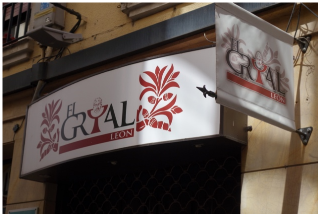
Fig. 8. L'enseigne du bar « El Grial », León, Calle López Castrillón. avril 2018.

« habiter » et, peut-être, auquel on puisse croire ? Paradoxalement, c'est plutôt hors de León et, même, hors d'Espagne que cette proposition trouve quelque résonance : en témoignent les réceptions de l'ouvrage, traduit en anglais dès 2015 et adapté récemment à l'écran, et l'investissement du calice par la sphère de l'occulte et de l'ésotérisme. Si les touristes affluent au musée de San Isidoro, sans doute est-ce pour suivre la piste du Graal et pour en éprouver, par les sens, le capiteux mystère.